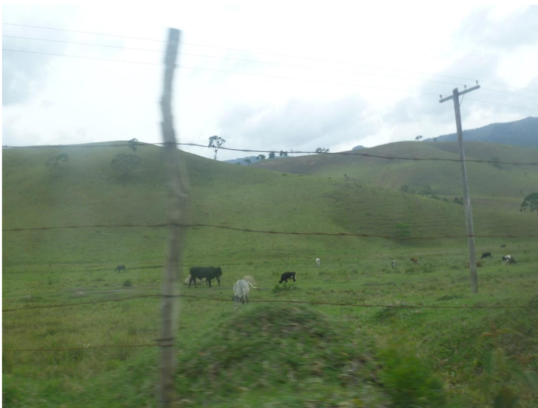
Pecuária - Estrada do Peitudo