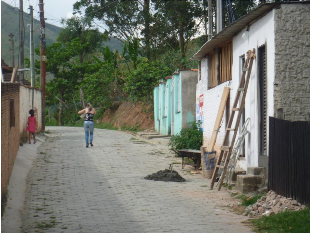
CDHU Vila Mariana - Rua José Bueno