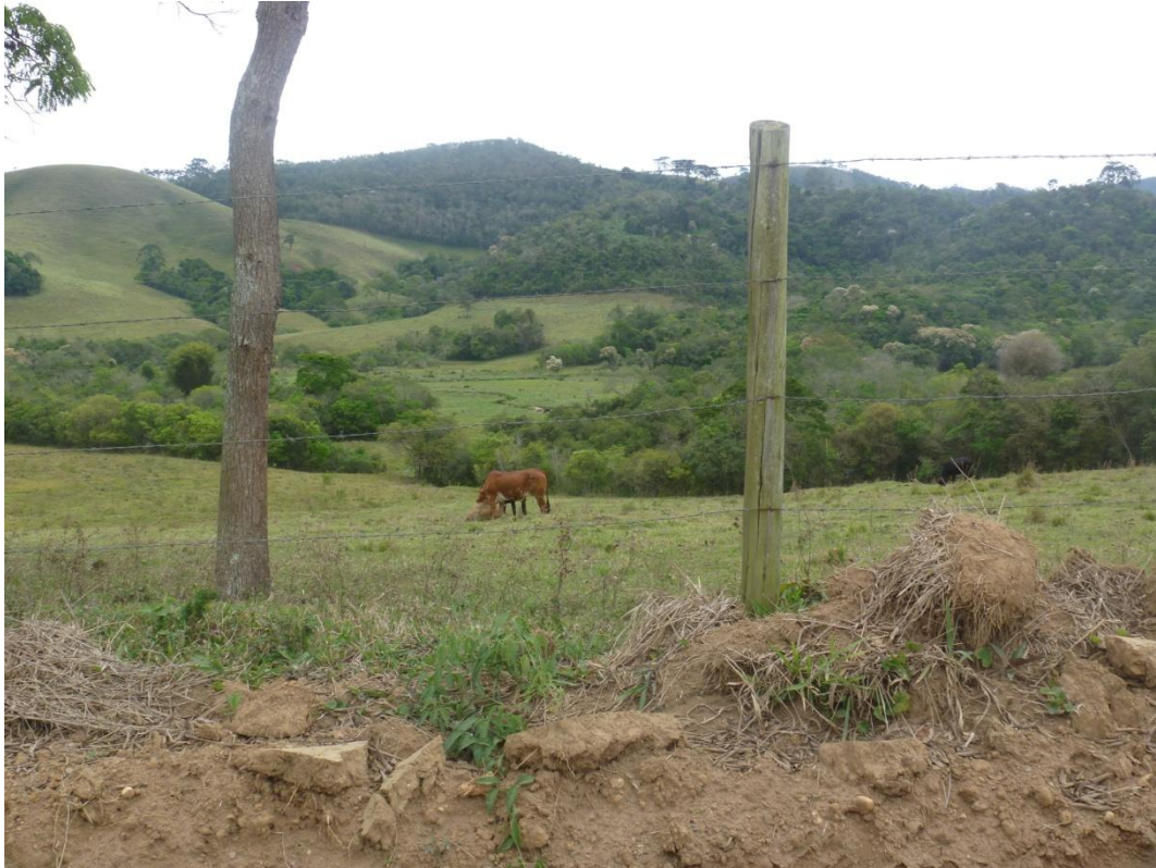
Vegetação Mata - Estrada do Peitudo