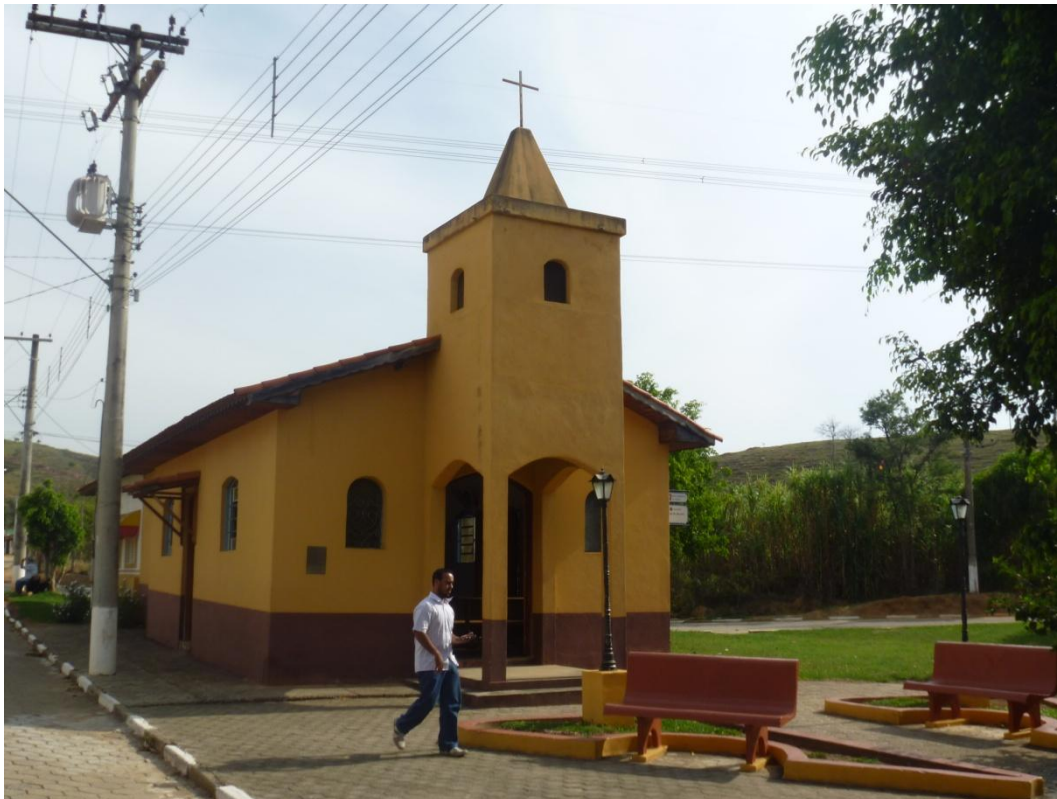
Igreja São José - Rua Afonso Lemos dos Santos