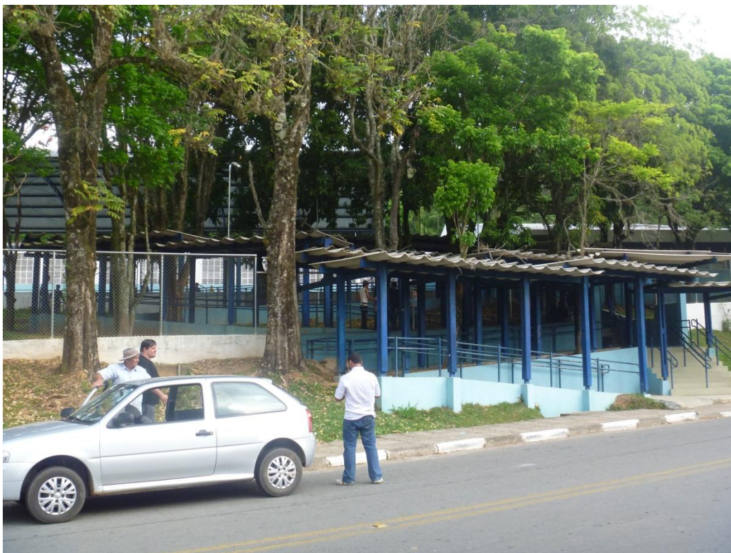
EE Hildebrando Martins Sodero - Avenida Cyro Moreira de Andrade