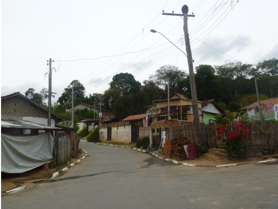
Padrão residencial de baixo padrão - Bairro dos Macacos