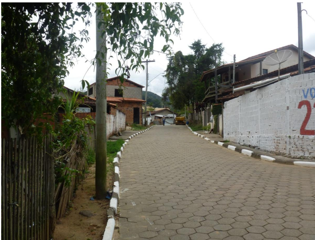
Padrão residencial médio - Bairro dos Macacos