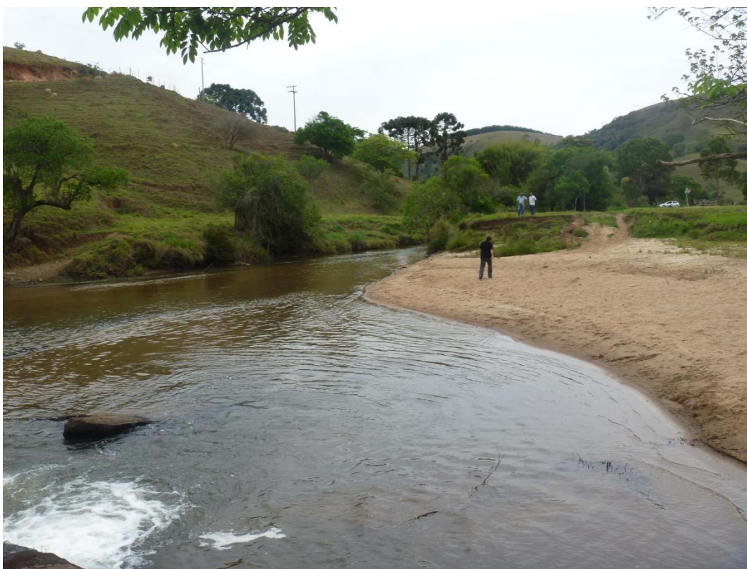
Rio Paraitinga ao sul da UIT 2 – APA Silveiras