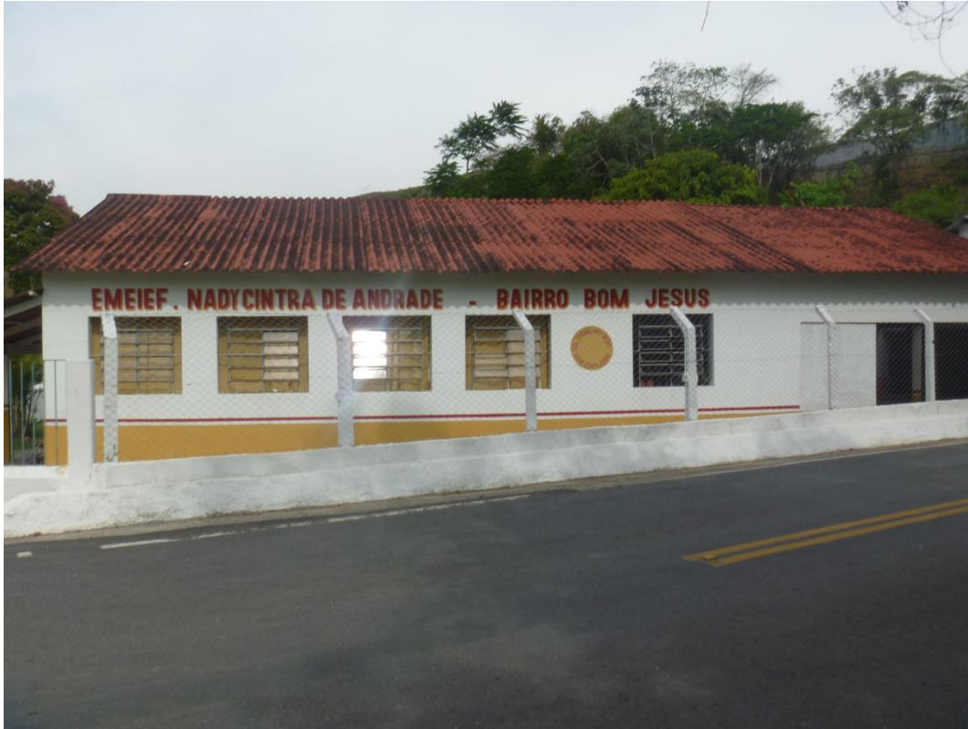
EMEIEF Nady Cintra de Andrade – Bairro Bom Jesus Rua José Mendes de Andrade