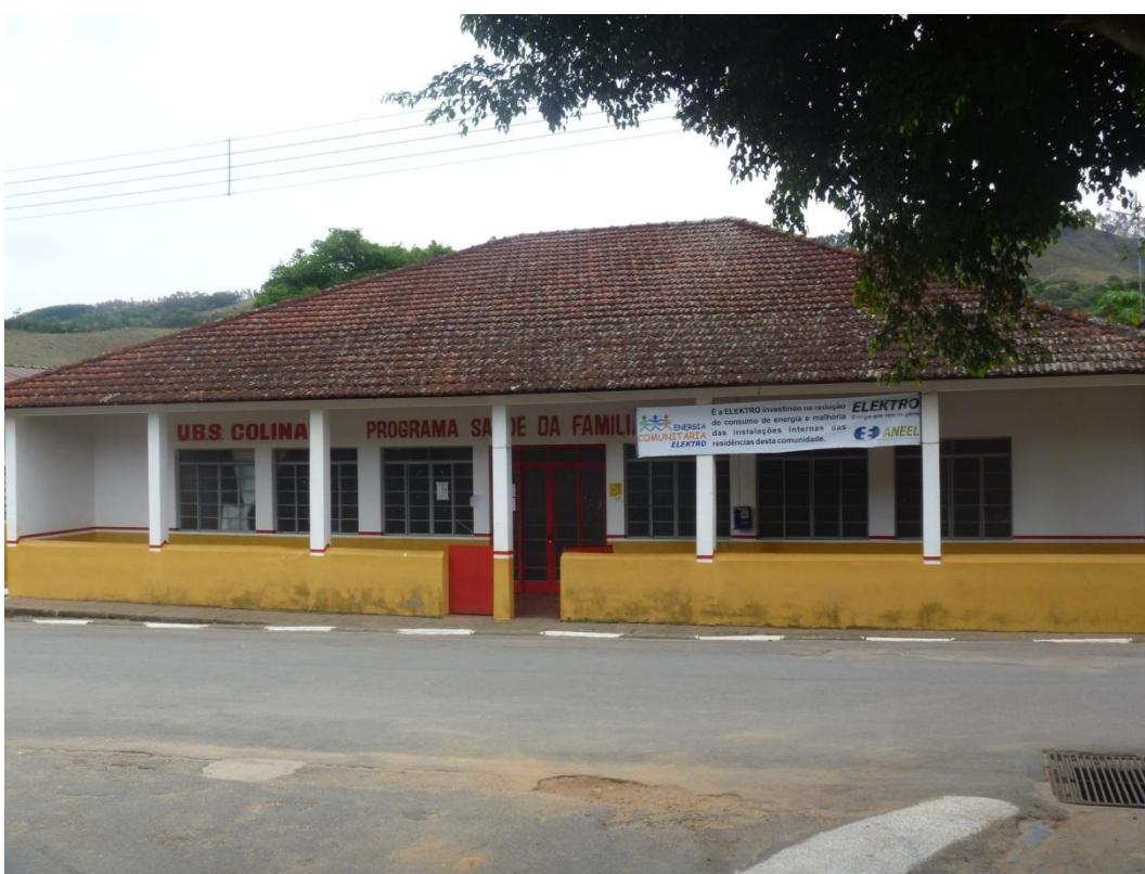
Programa de Saúde da Família – PSF Bairro dos Macacos - Rua Nossa Senhora do Patrocínio