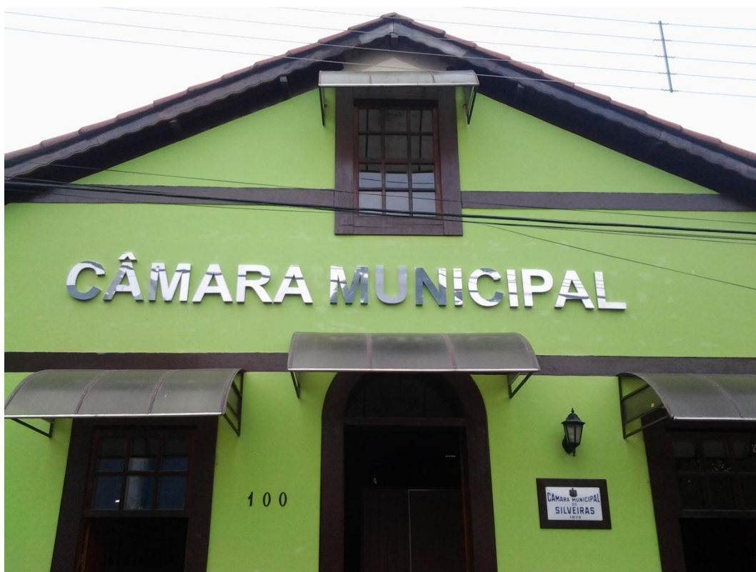
Câmara Municipal de Silveiras Rua Mestre João Batista Julião

O registro fotográfico ilustra a visita ao município de Silveiras realizada no dia 19/10/2012, pela equipe da FESPSP, acompanhada pelo técnico da Prefeitura Municipal de Silveiras: