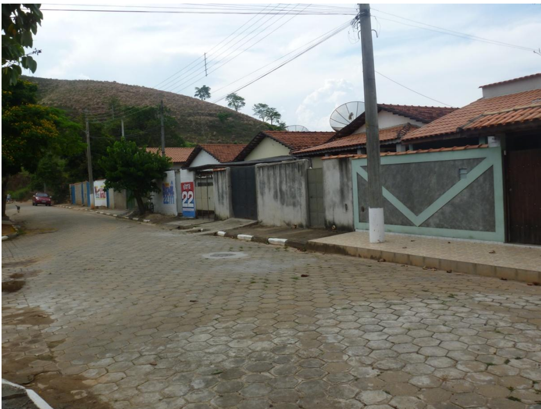
CDHU Mário Covas - Avenida Mário Covas