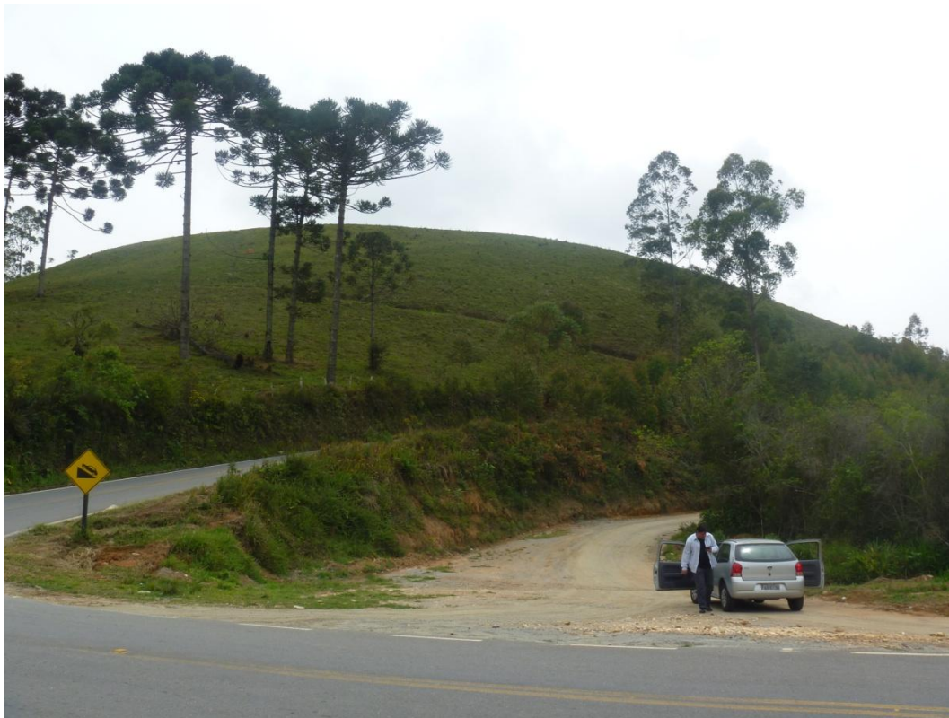
Entrada do bairro rural Calunga Rodovia Prefeito Osvaldo de Paula Cardoso

O registro fotográfico a seguir apresenta a pesquisa realizada in loco , no dia 19/10/2012, pela equipe da FESPSP, acompanhada pelo técnico da Prefeitura Municipal de Silveiras: