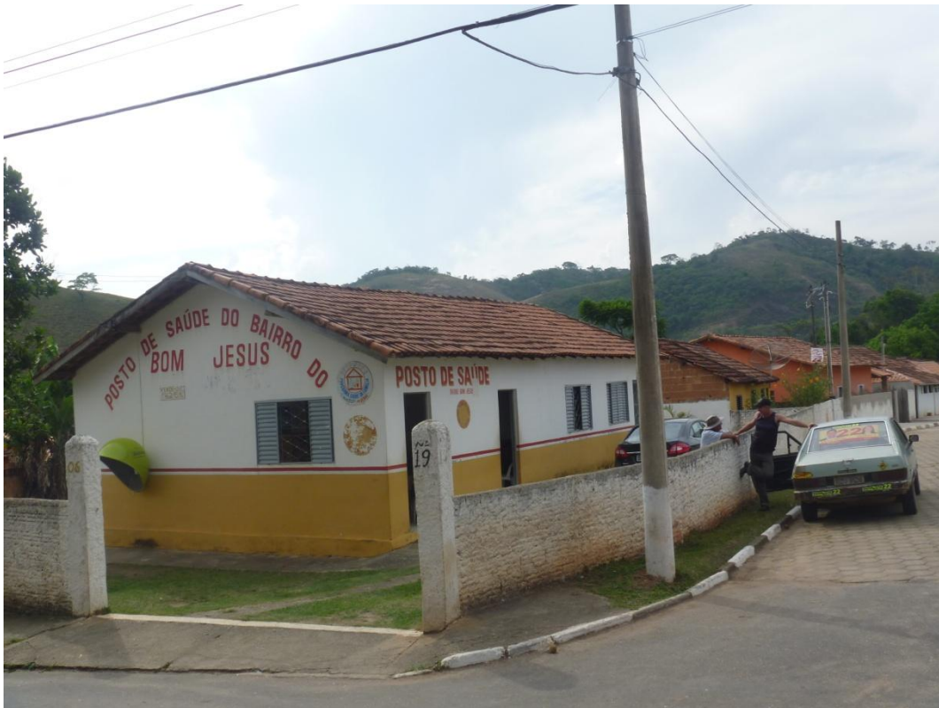
Posto de Saúde – Bairro Bom Jesus