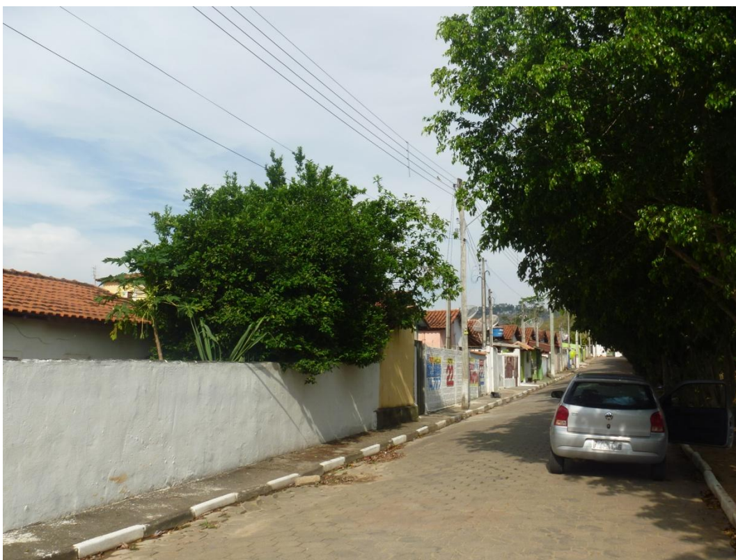
CDHU Vila Esperança - Rua José Carvalho da Silva