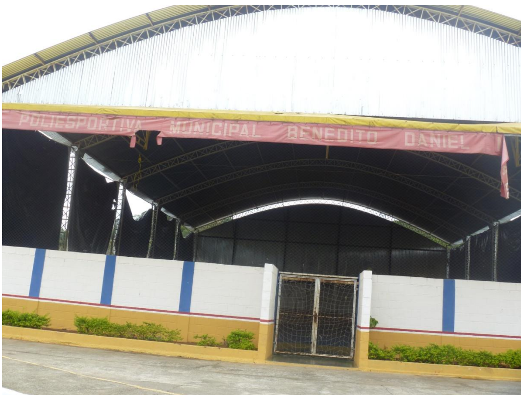
Quadra Poliesportiva Municipal Benedito Daniel - Bairro dos Macacos