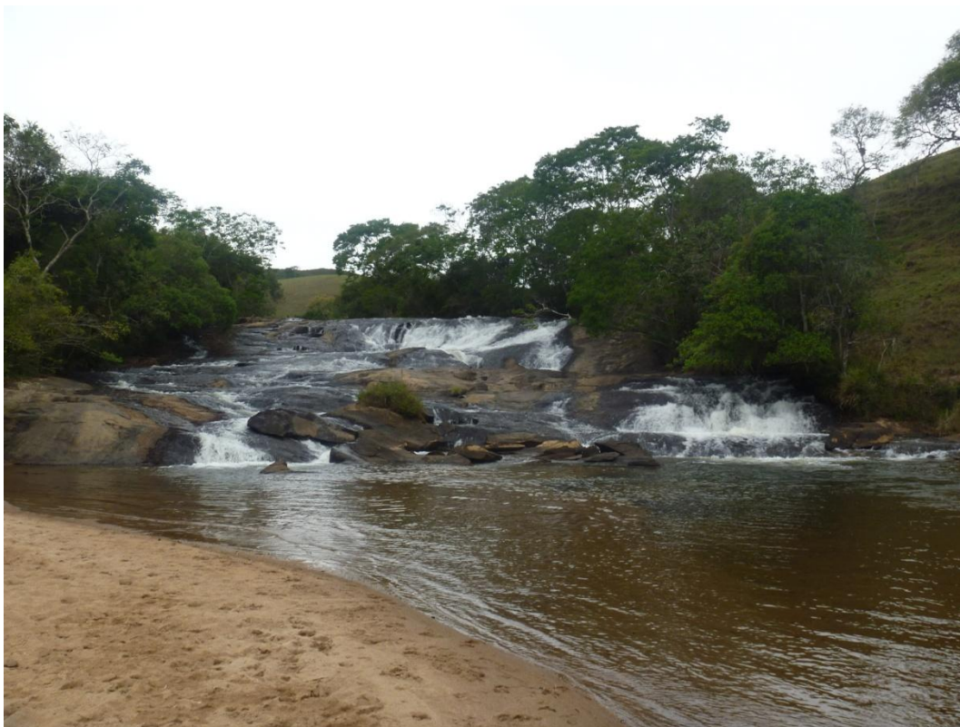
Rio Paraitinga ao sul da UIT 2 – APA Silveiras