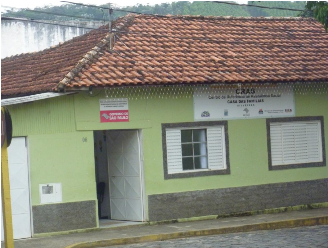
CRAS – Centro de Referência de Assistência Social Praça Tenente Anacleto Pereira Pinto