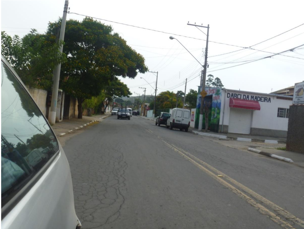
Padrão comercial - Avenida Cyro Moreira de Andrade