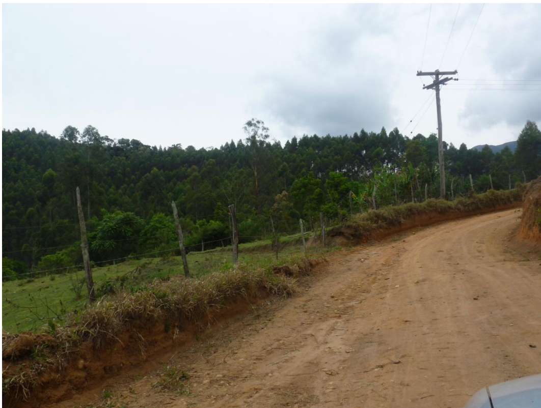
Silvicultura - Estrada do Peitudo