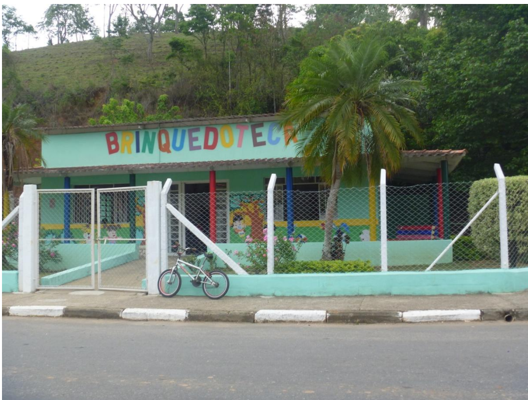
Brinquedoteca - Avenida Mario de Paula Cardoso