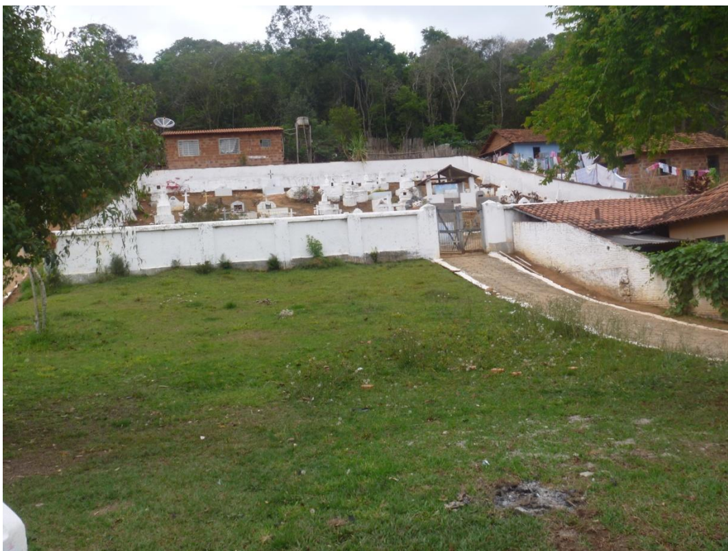
Cemitério do bairro dos Macacos