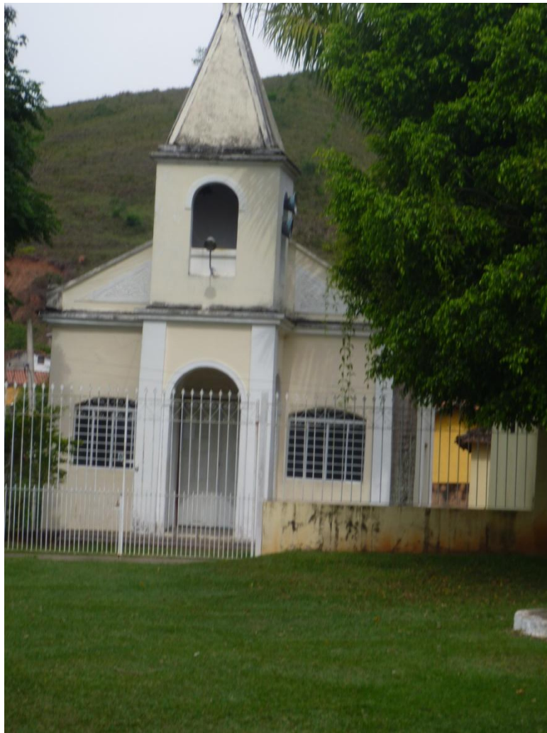
Igreja bairro Bom Jesus - Rua José Mendes de Andrade