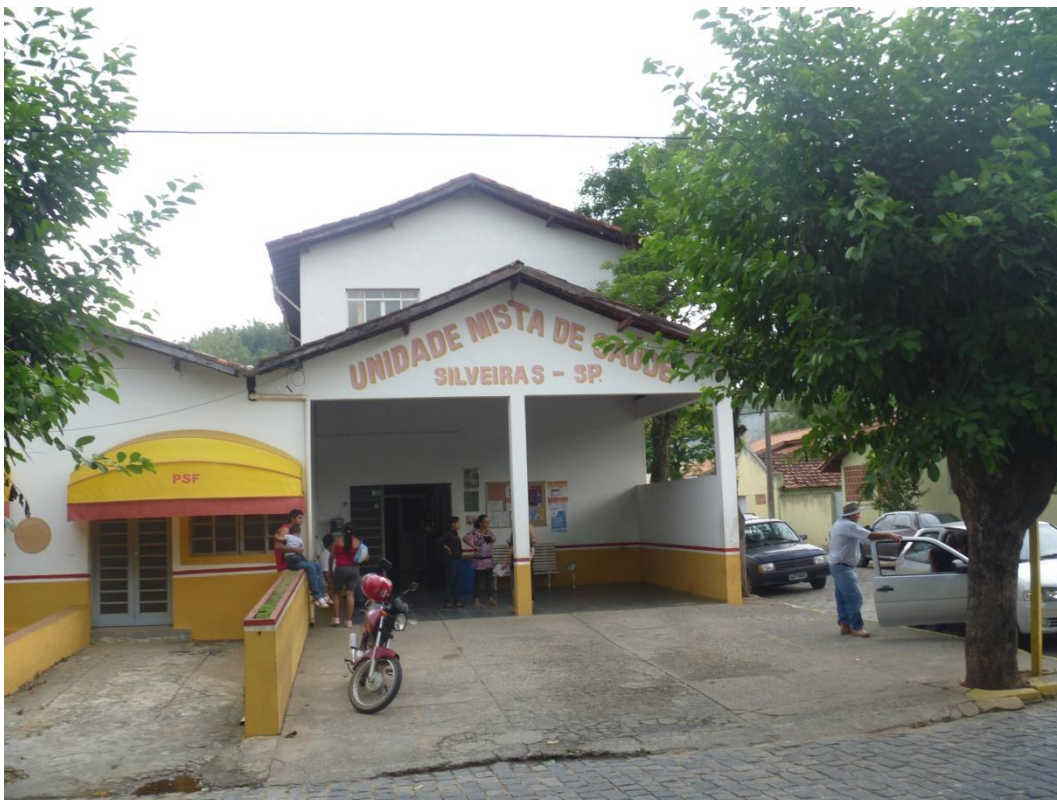
Unidade Mista de Saúde