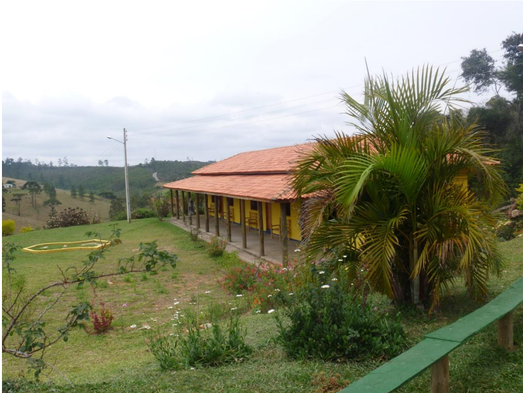
Pousada da Marina - Bairro Calunga