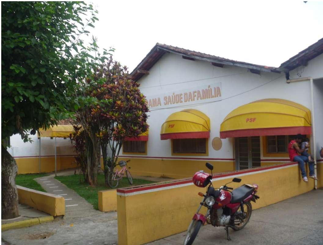
Programa Saúde da Família – PSF Praça Padre Joaquim Ferreira da Cunha