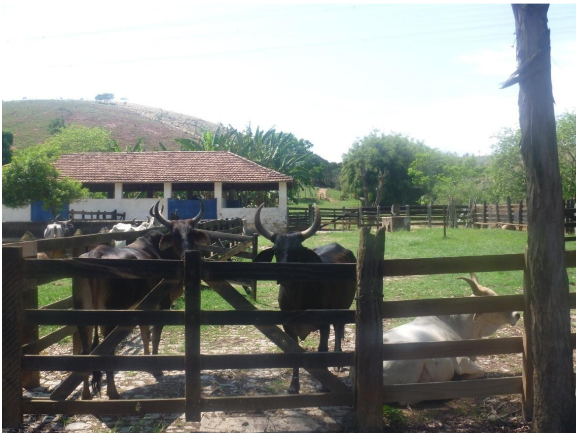
Criação intensiva de Gado