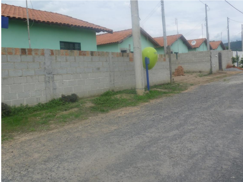
Padrão construtivo CDHU (Av. Kaname Yaegashi)