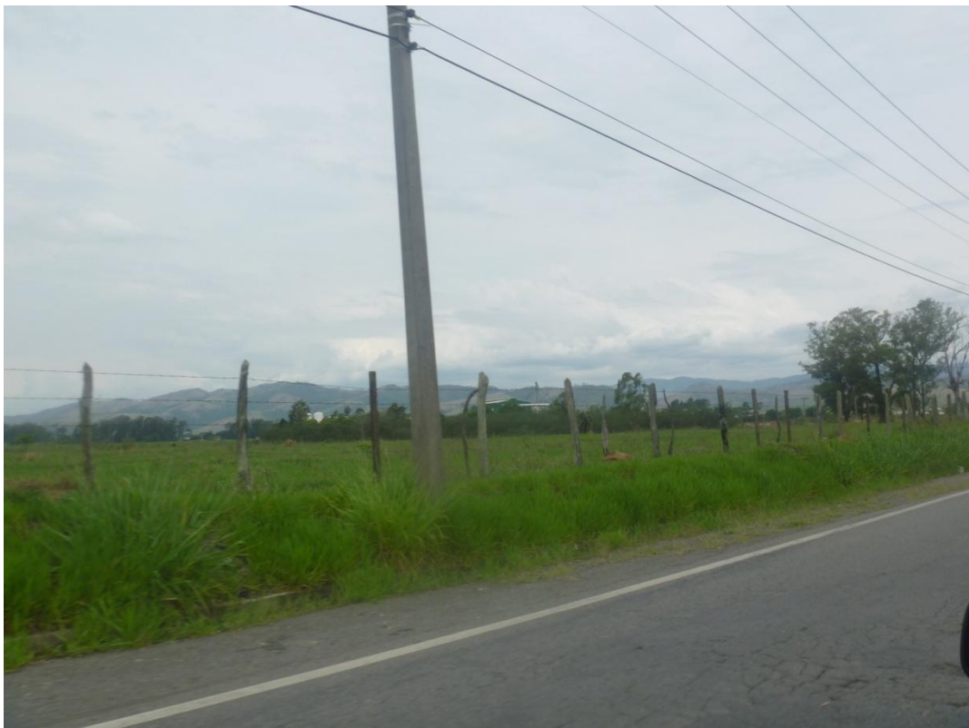
Pasto ao longo da Rodovia Vereador Abel Fabricio Dias