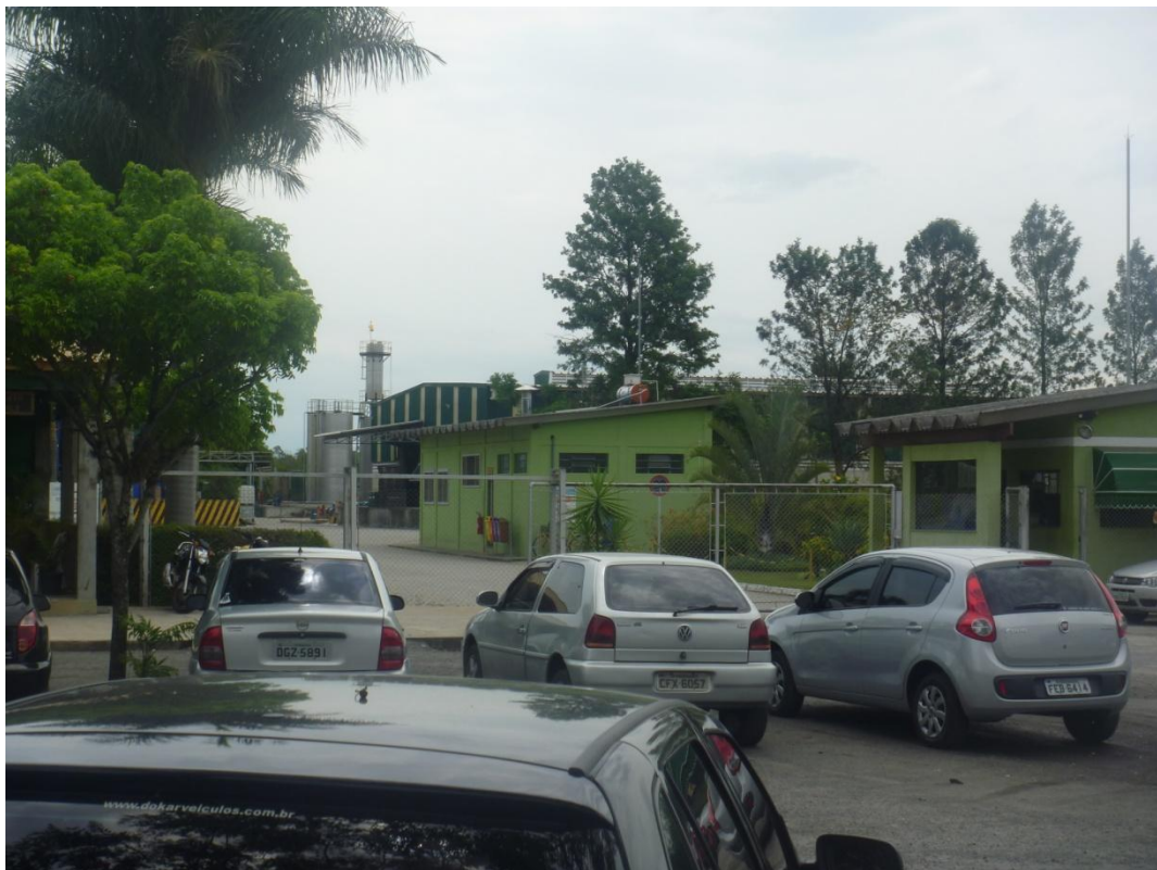
Exemplo de unidade industrial (Rod. Vereador Abel Fabricio Dias)