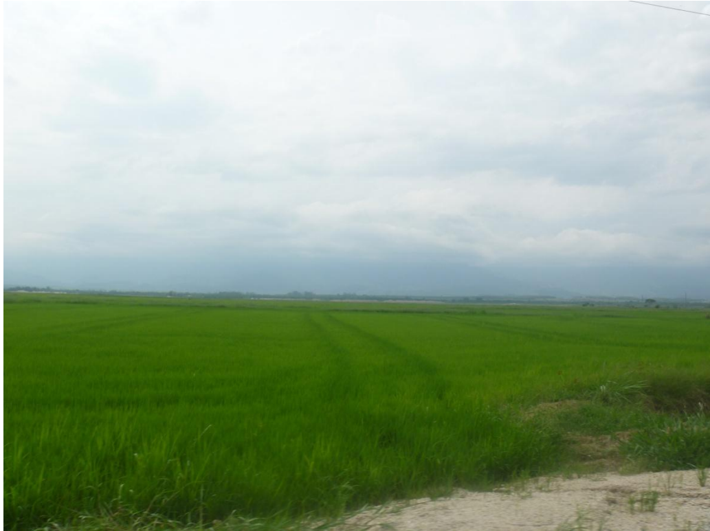
Cultura de Arroz ao longo da Várzea