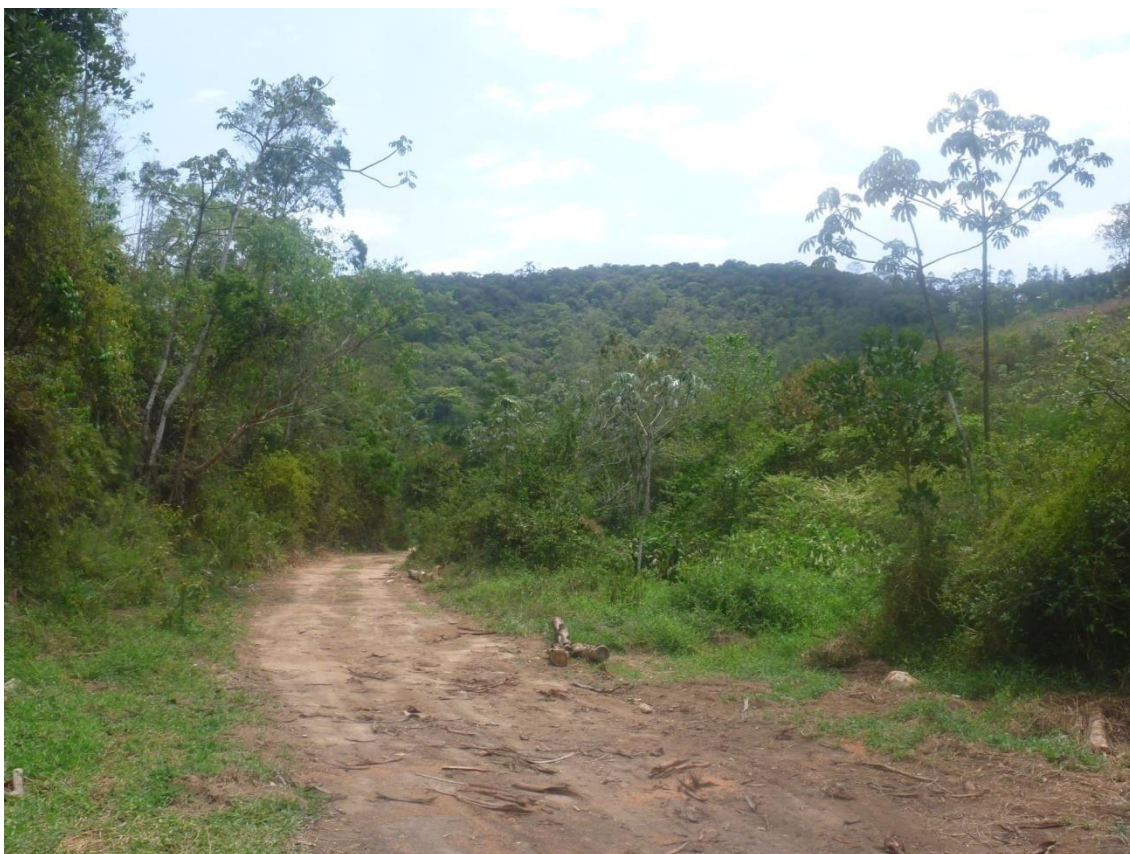
Outro registro da mata preservada próximo a Serra Quebra Cangalha