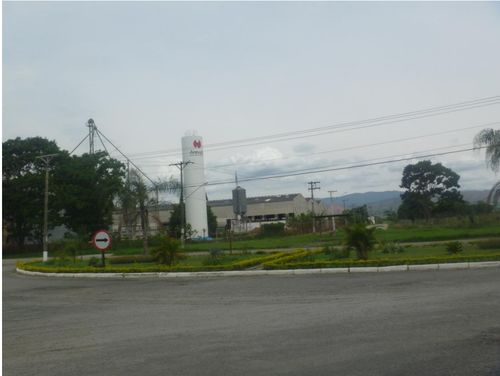
Área industrial de Roseira (Rod. Vereador Abel Fabricio Dias)