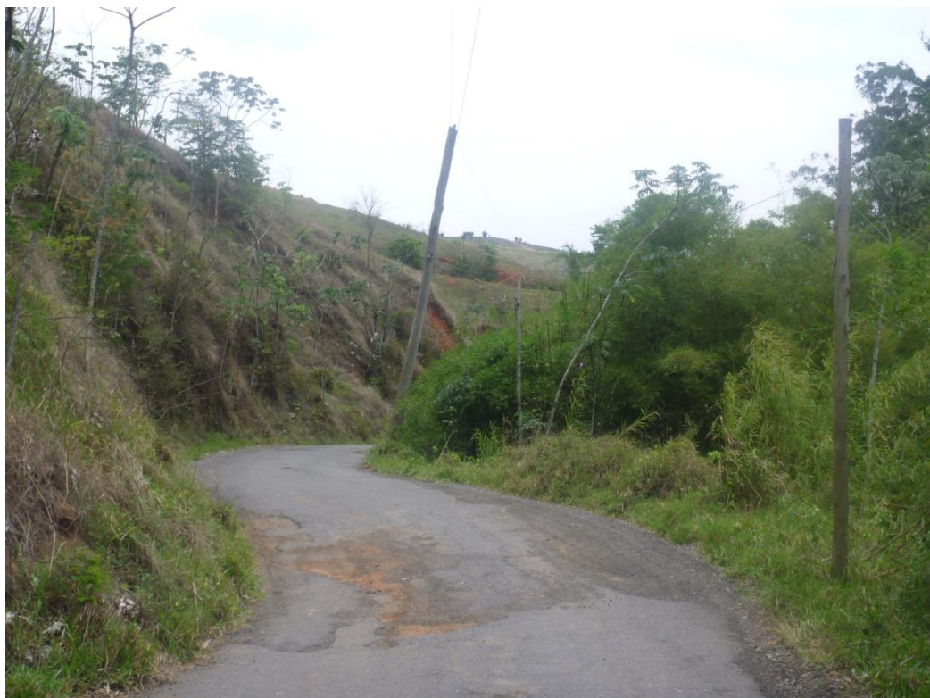
Estrada vicinal Francisco de Assis Vieira