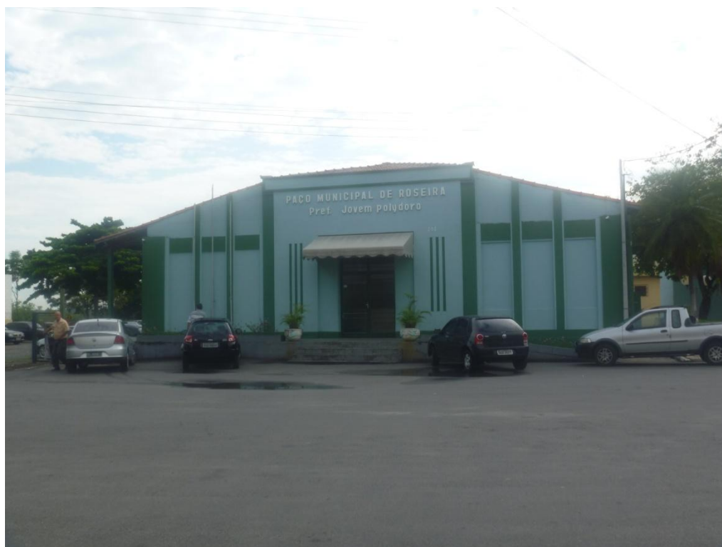
Sede da Prefeitura de Roseira