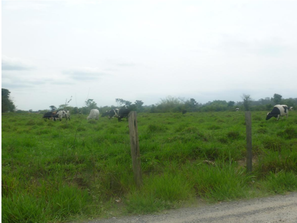
Exemplo de Atividade pecuária extensiva