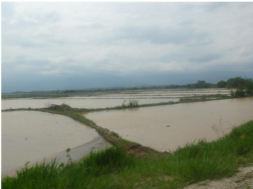
Outro exemplo do cultivo do Arroz