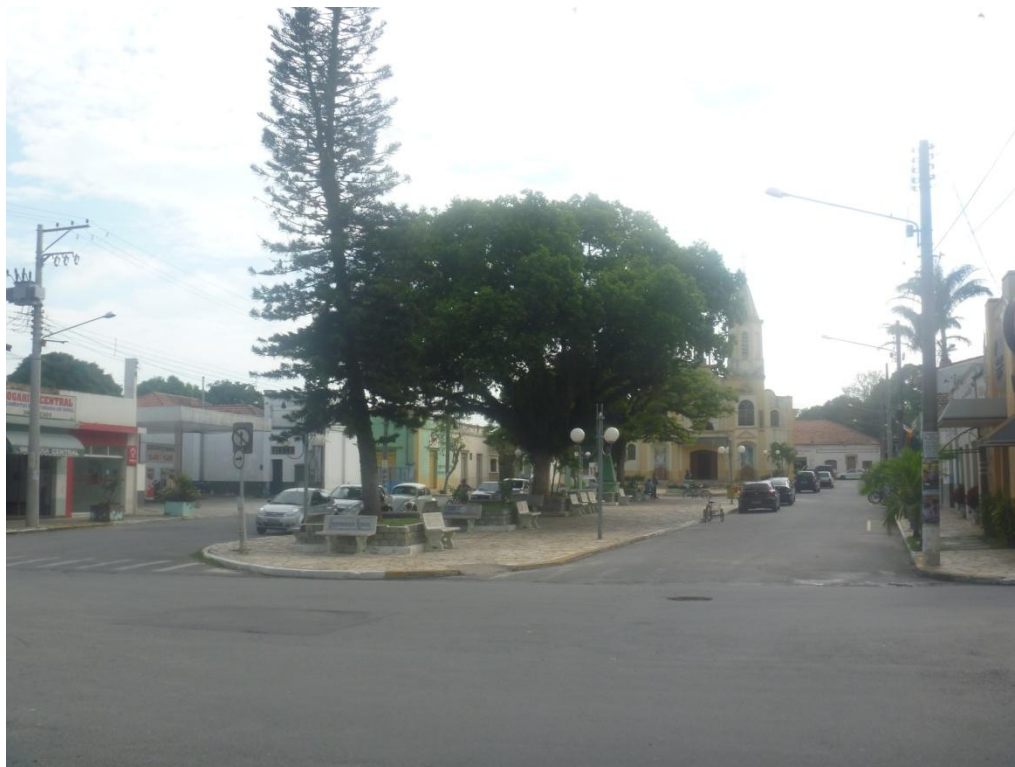
Padrão comercial (Praça Santana – centro)