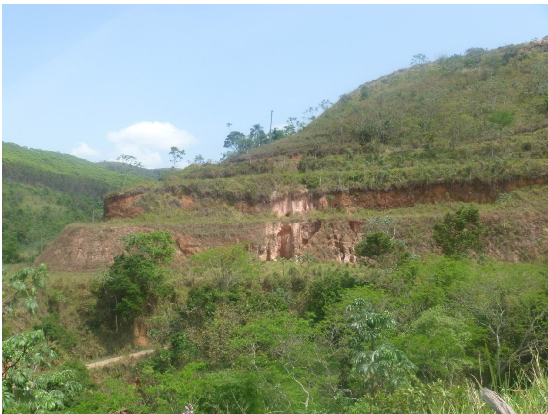
Ponto de forte erosão e silvicultura ao fundo à esquerda