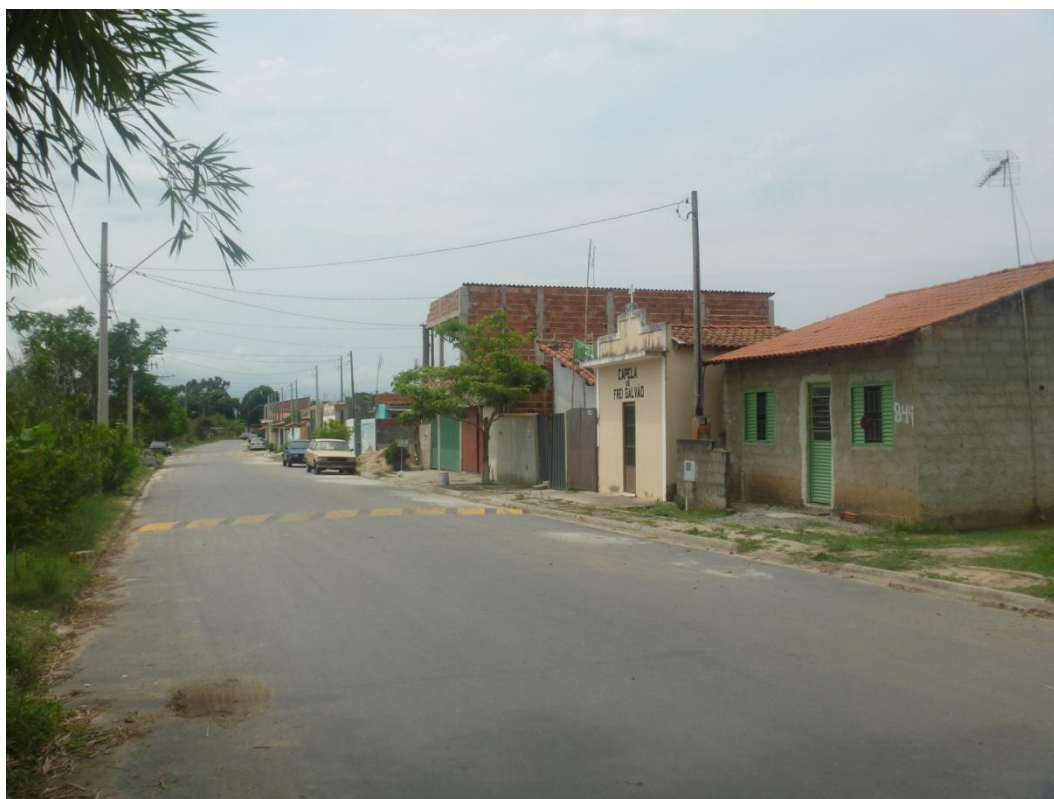
Habitação precária (Bairro Barretinho)