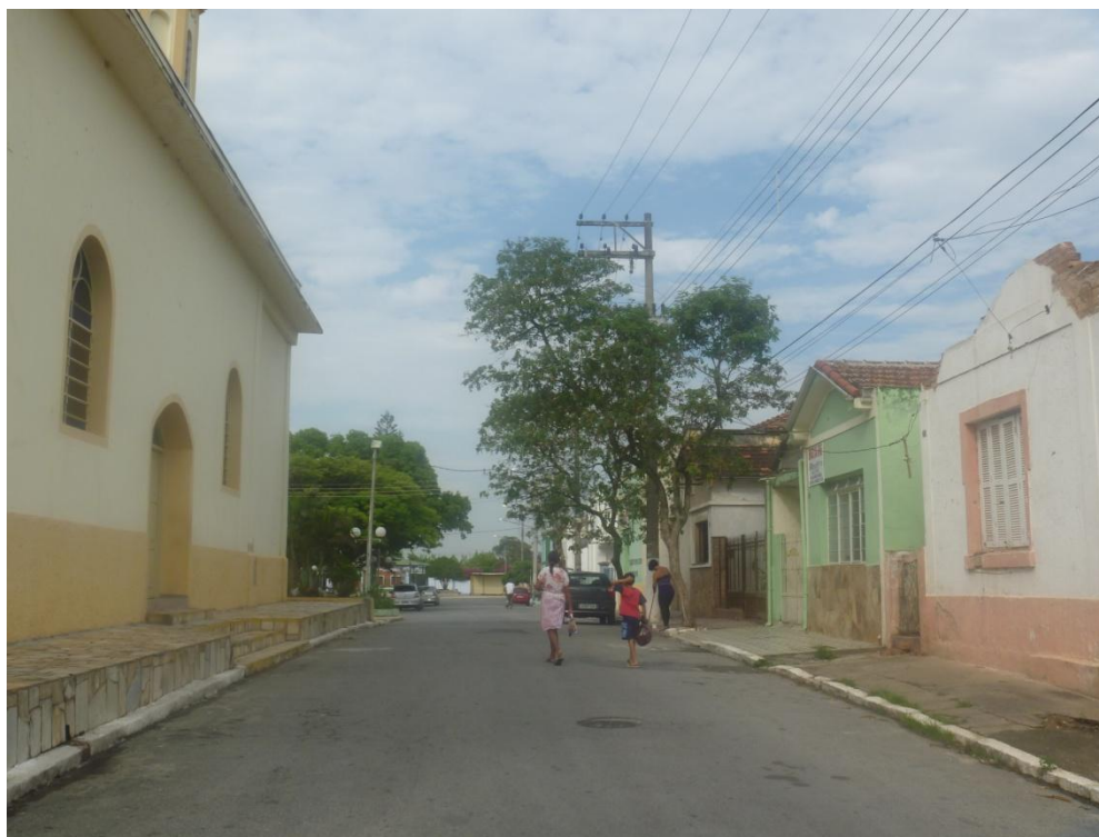
Padrão residencial Centro (ao lado da Igreja Santana)