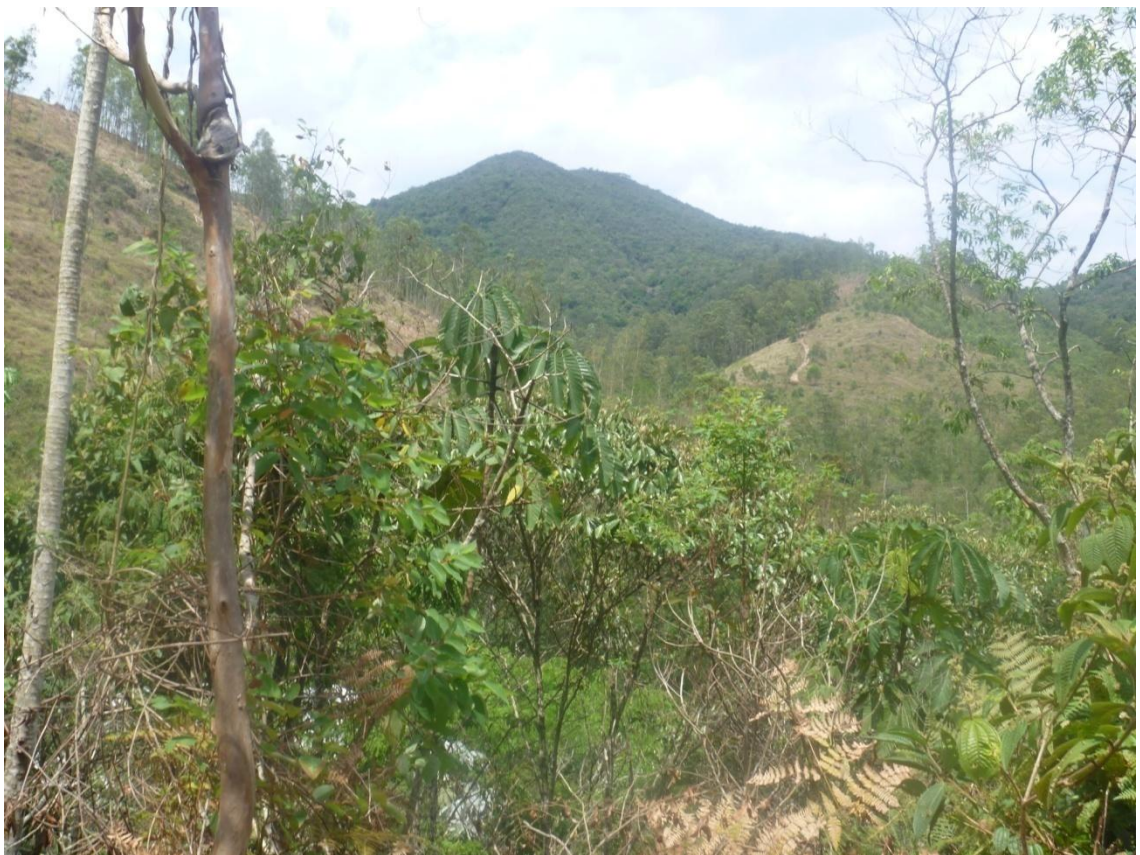
Mata em ponto próximo da Serra Quebra Cangalha