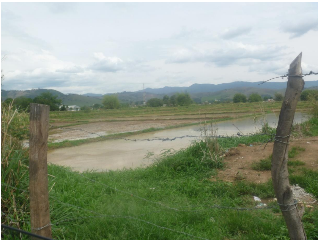
Detalhe de área de Cultivo de Arroz