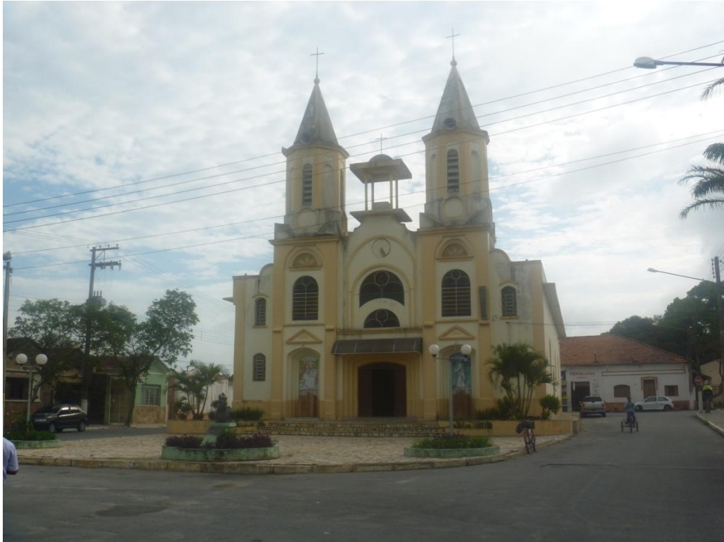
Igreja Santana (1910) - Praça Santana