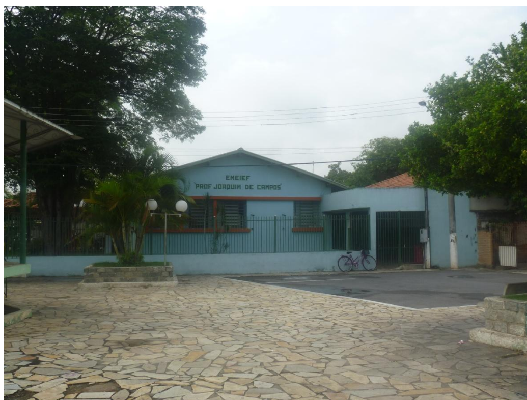
EMEIEF Joaquim de campos e à noite construção é usada como FATEC (Rua Major Vitoriano, 6)