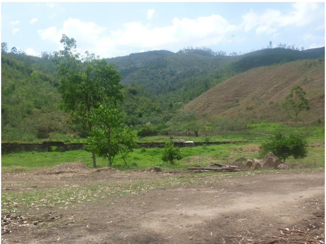
Silvicultura ao fundo e estrutura abandonada