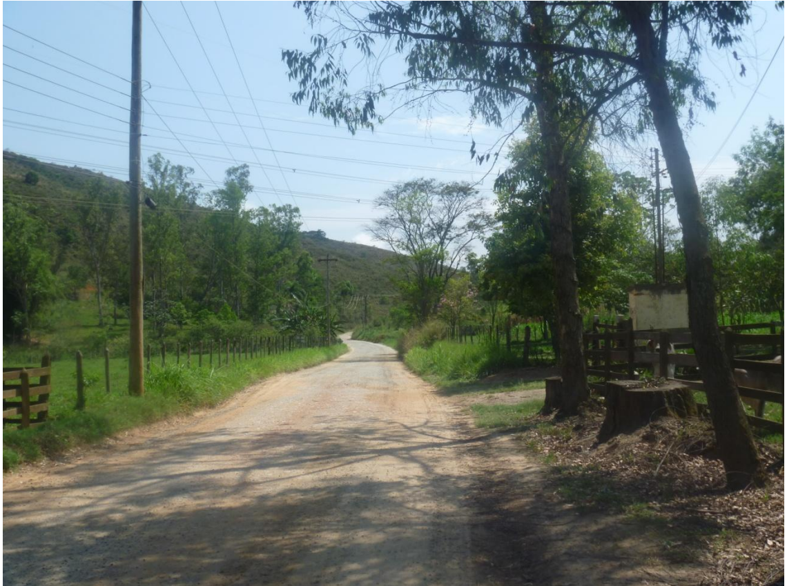
Estrada vicinal Antonio Fazzeri importante meio de acesso a UIT 3