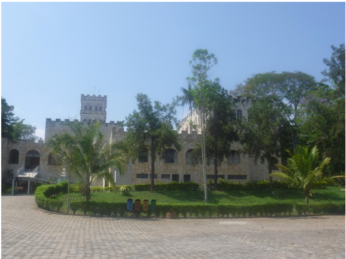
Frente do Mosteiro Sagrada Face (Estrada vicinal Antônio Fazzeri)