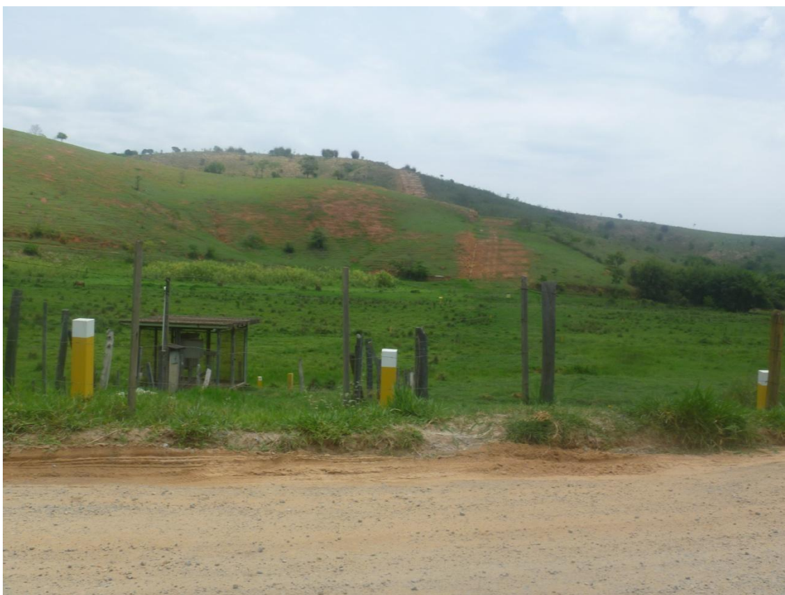
Registro de Gaseoduto