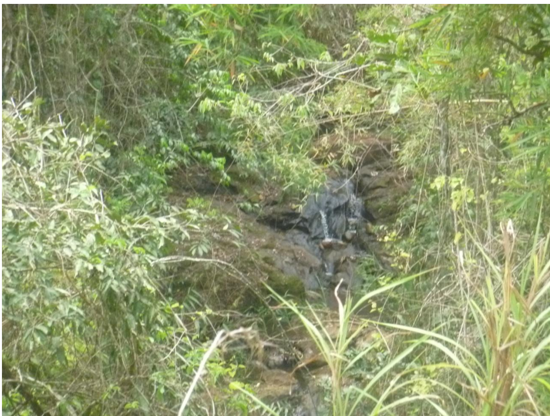
Detalhe de Riacho na APA Municipal de Roseira