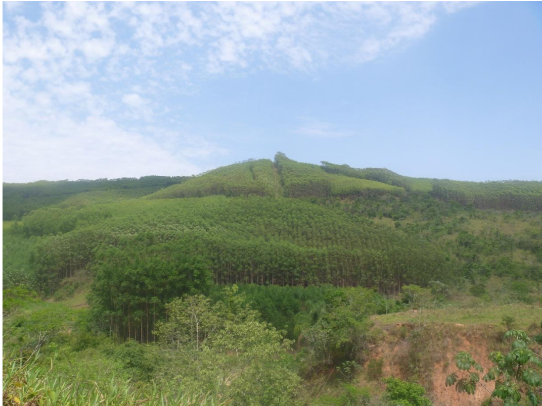
Registro de silvicultura (Estrada Vicinal Antônio Fazzeri)

Segue o registro fotográfico efetuado durante trabalho de campo em 01/11/2012: