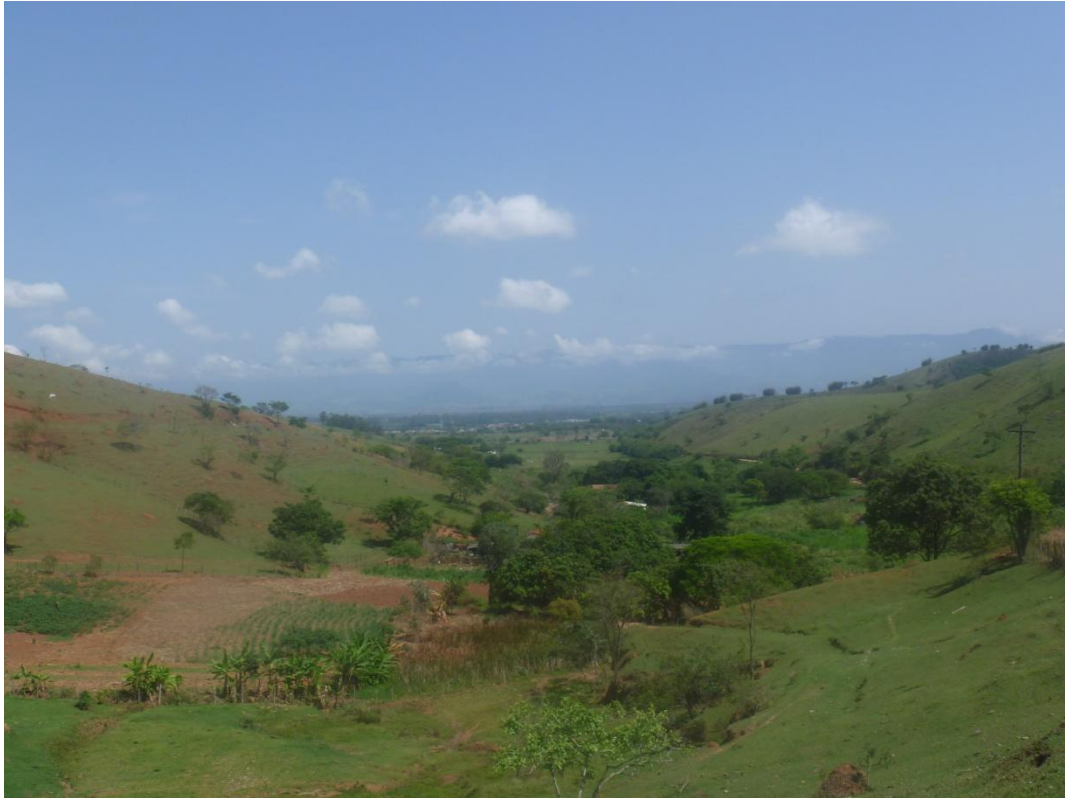
Área de produção agrícola (Estrada Vicinal Antônio Fazzeri)