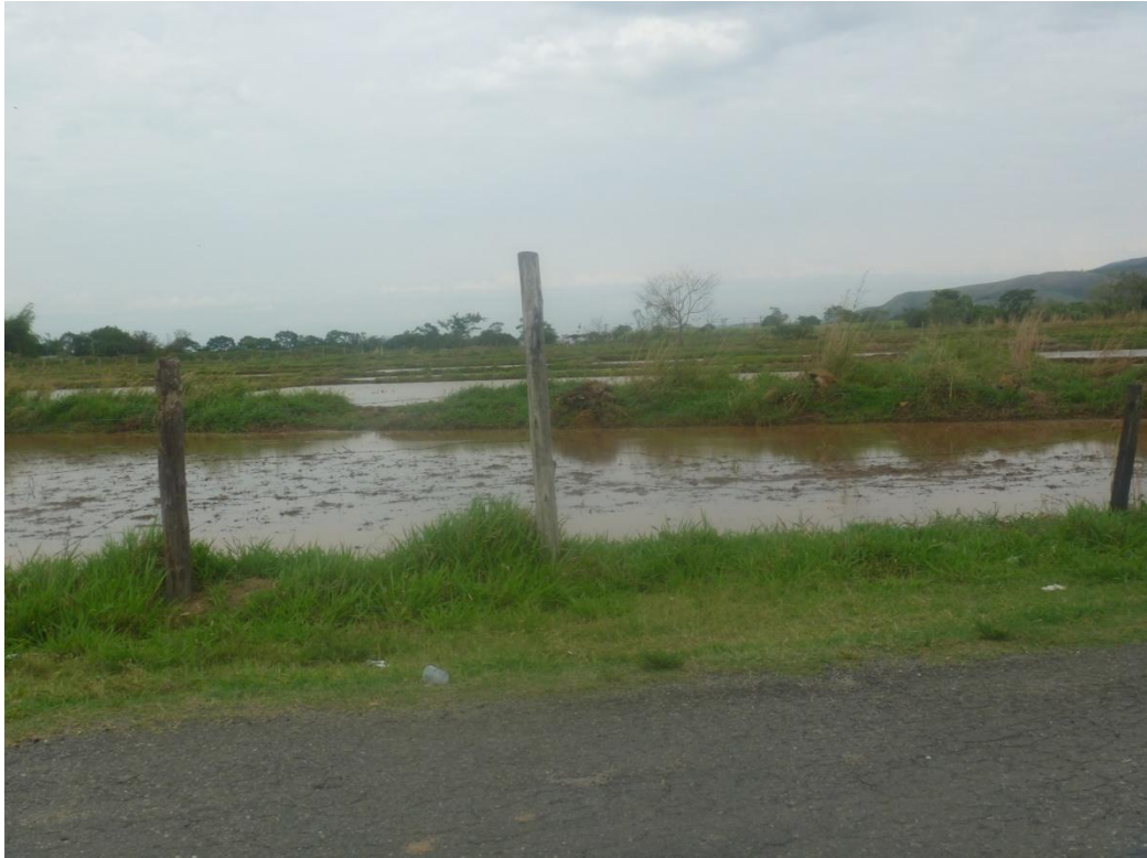
Cultivo de Arroz Alagado