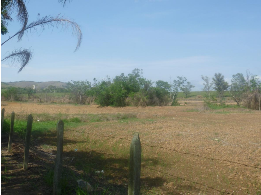
Área de plantio (vicinal Antônio Fazzeri)