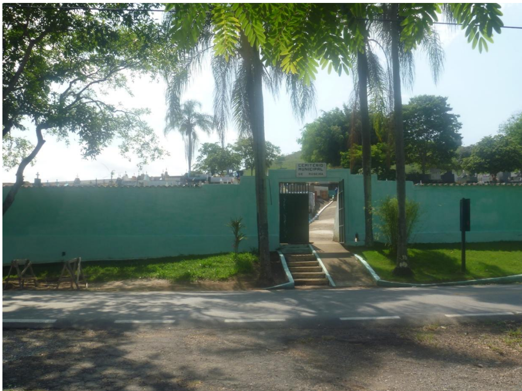
Cemitério Municipal (Estrada Vicinal Antônio Fazzeri)

Segue o registro fotográfico efetuado durante trabalho de campo em 01/11/2012: