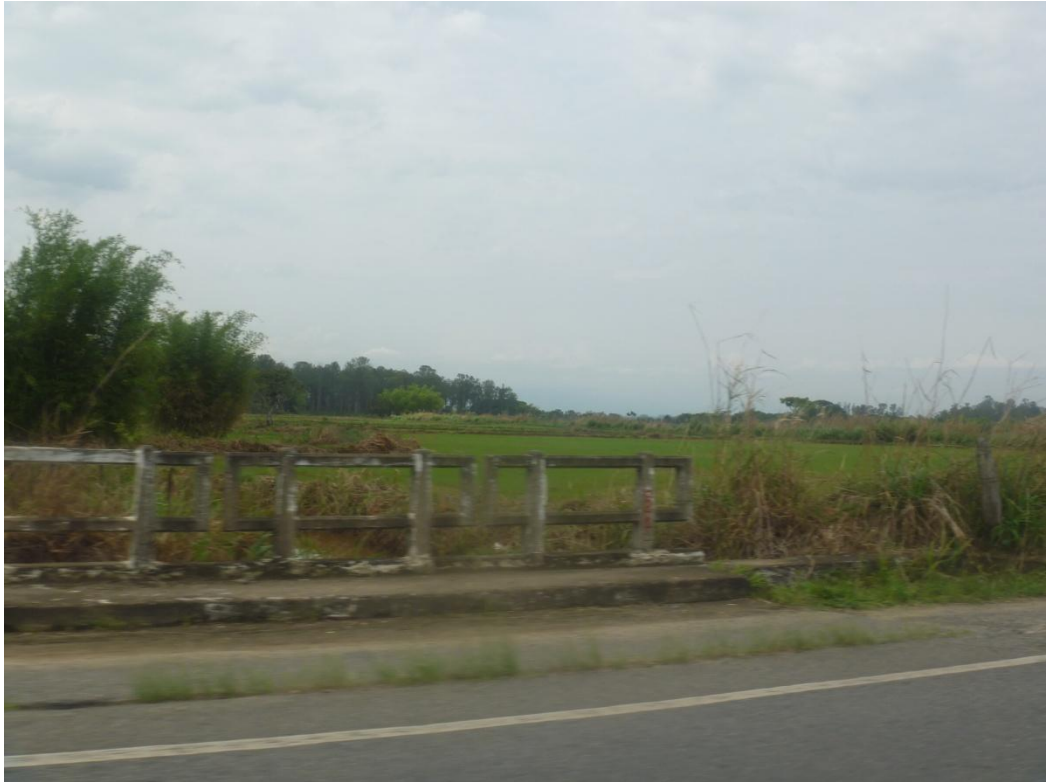
Arrozal ao longo da rodovia Washington Luis