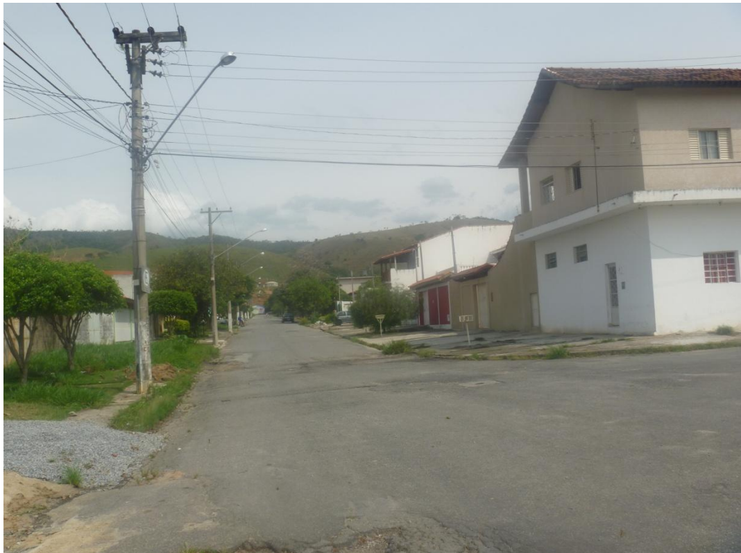
Área residencial em expansão Bairro Jardim