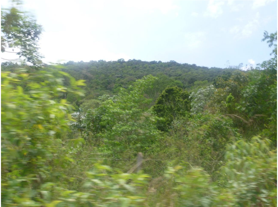
Registro de Mata próxima a APA municipal (Estrada vicinal Francisco de Assis Vieira)