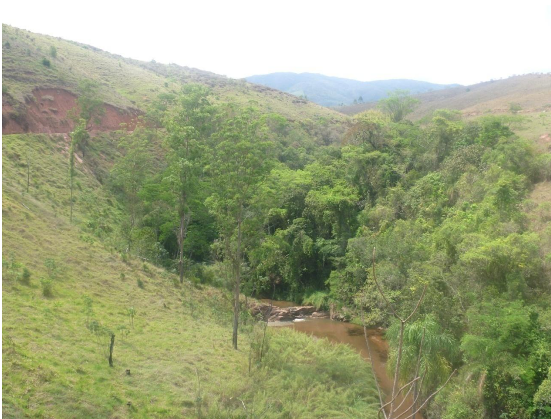
Riacho observado da vicinal Antônio Fazzeri