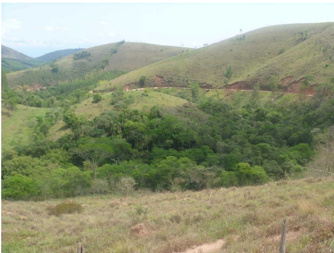
Área de mata ciliar