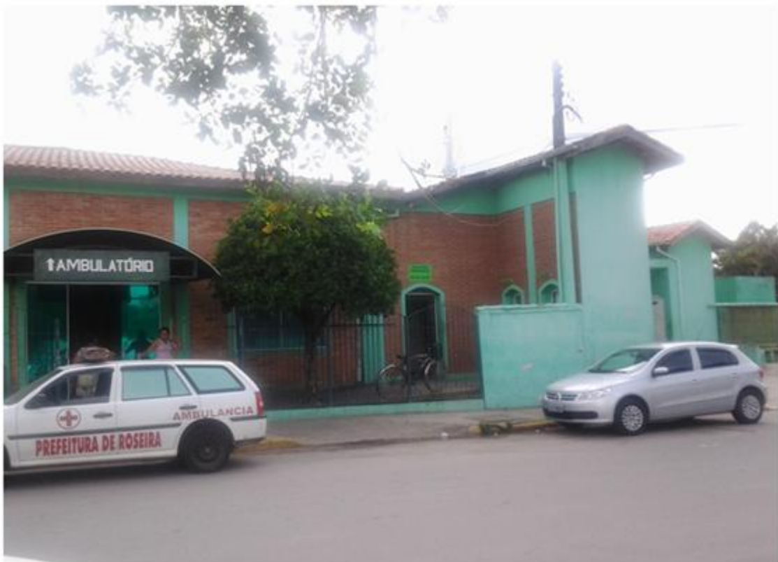
Unidade Mista de Saúde (Rua Duque de Caxias, S/N)