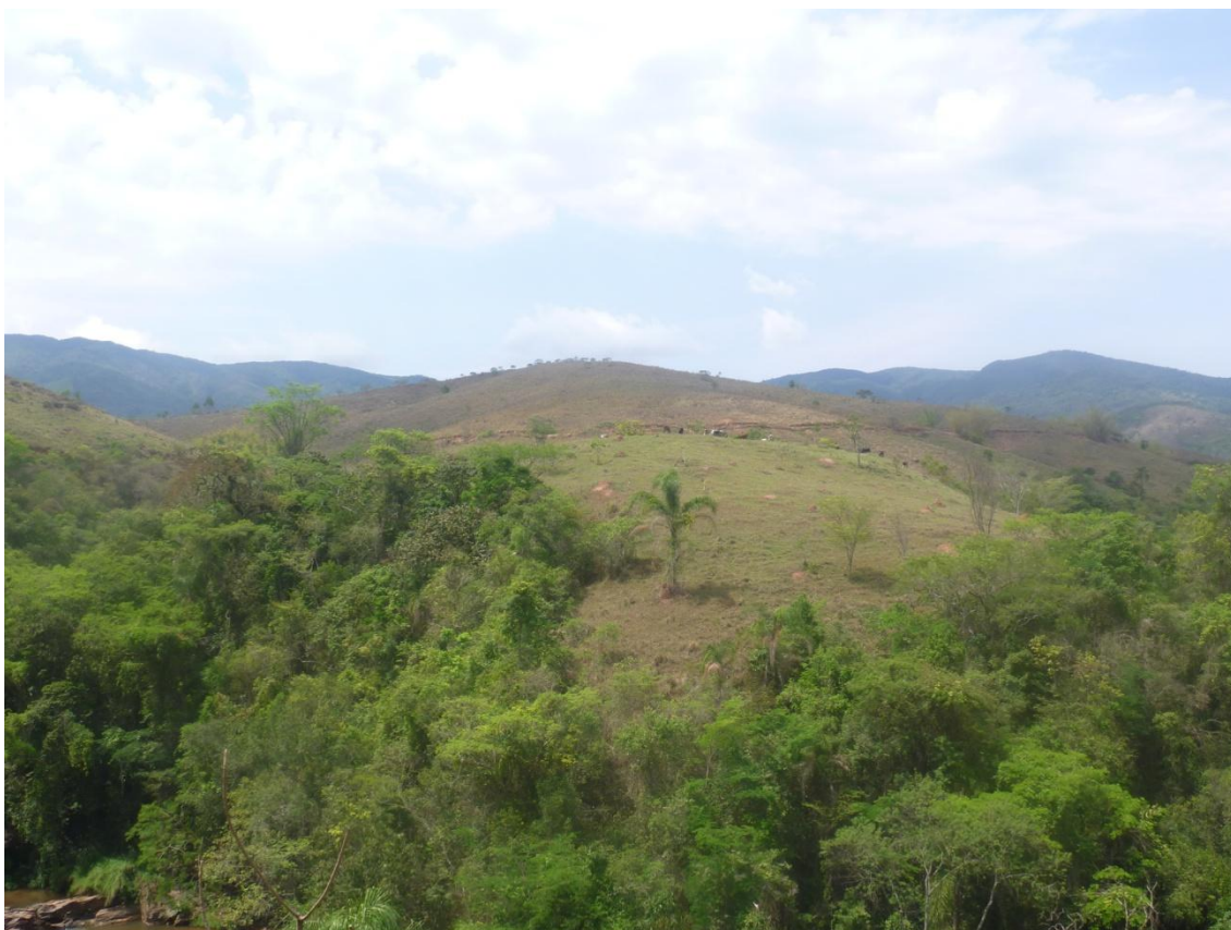
Registro de atividade pecuária.