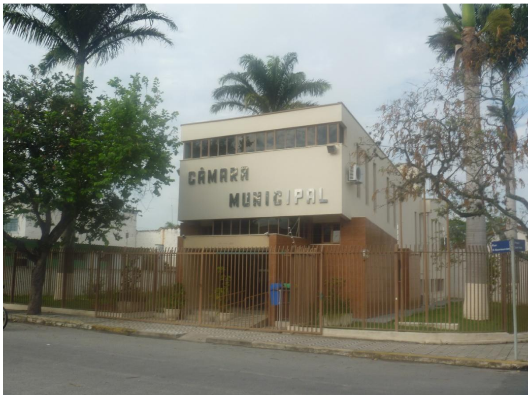
Câmara Municipal de Roseira - Rua D. Epaminondas