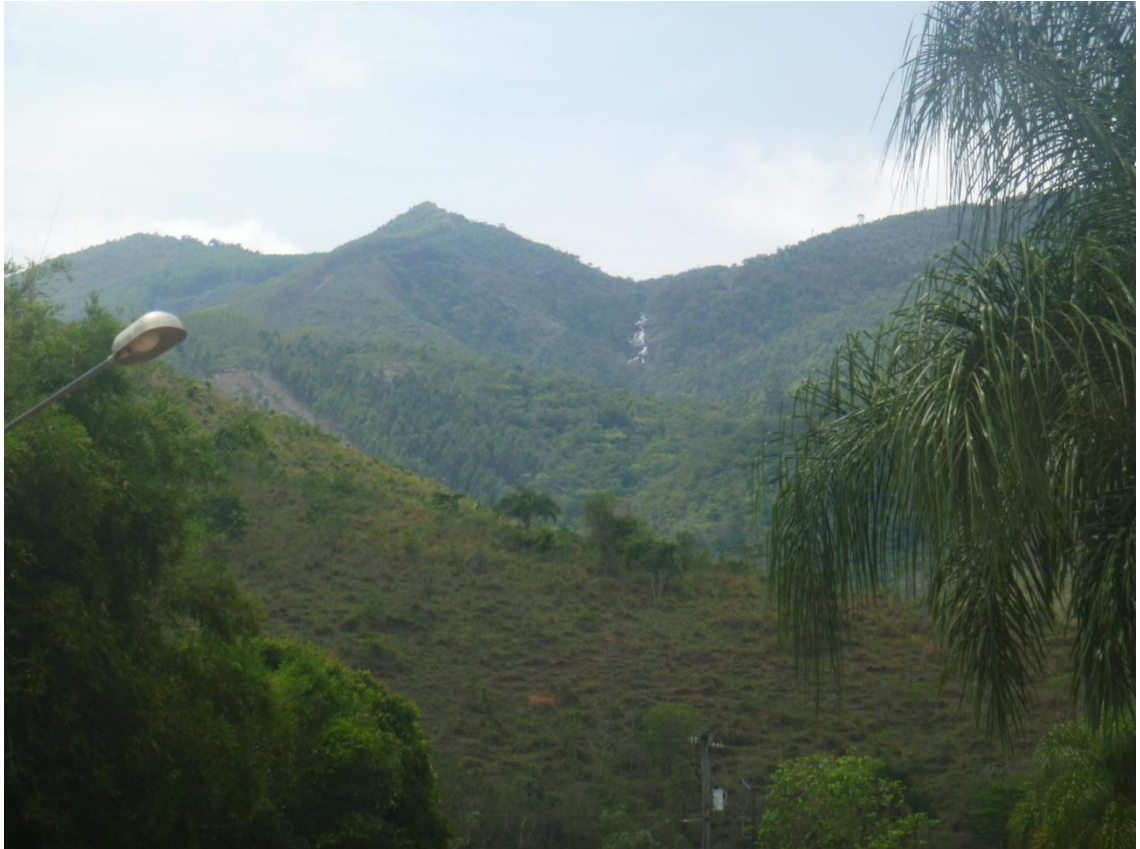
Cachoeira no alto da Serra Quebra Cangalha