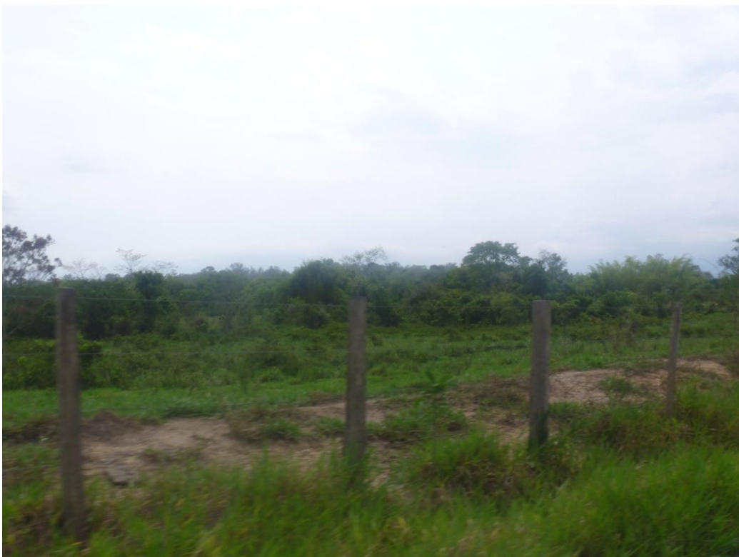
Exemplo de Mata