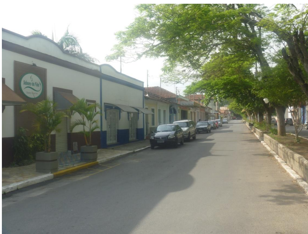
Padrão Comercial (Rua Major Vitoriano)