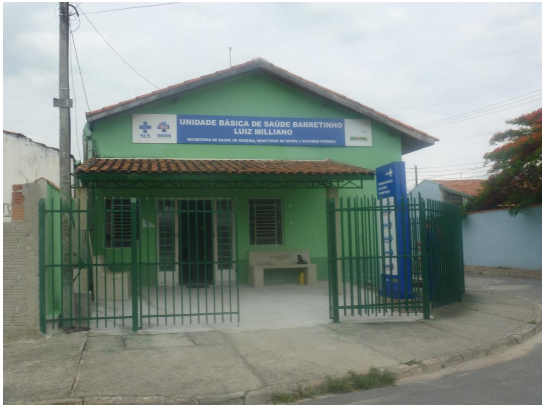
UBS do Bairro Barretinho