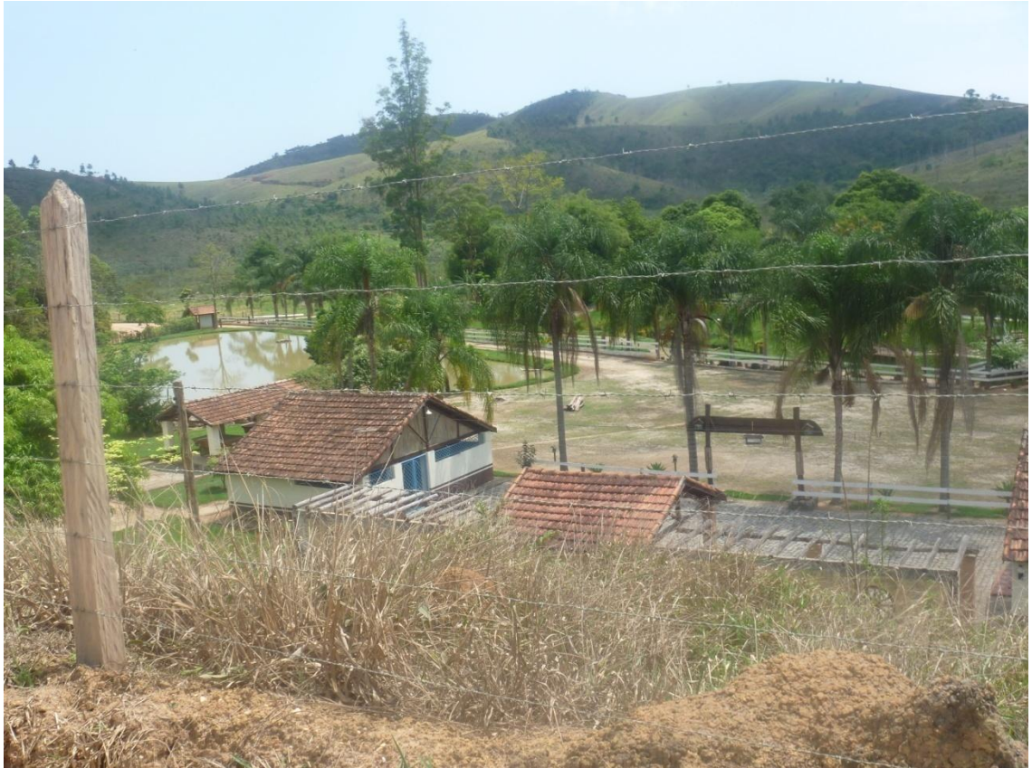
Área de clube fazenda fechado por falta de clientes