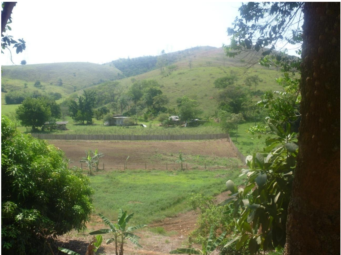
Área de cultivo (rodovia vicinal Antônio Fazzeri)