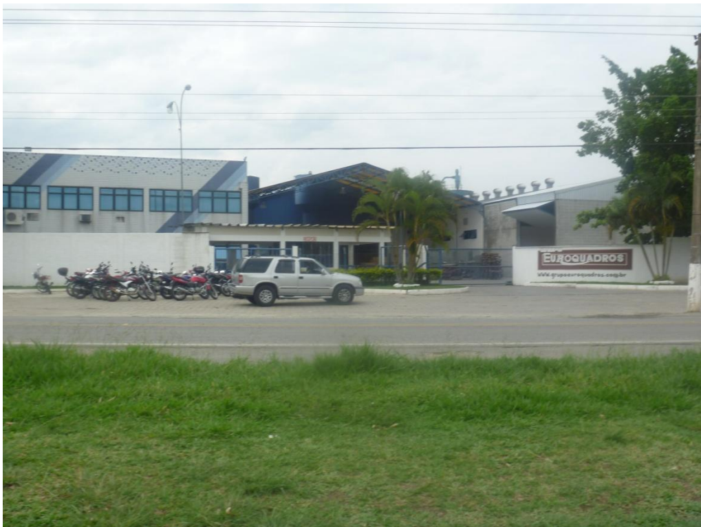
Unidade industrial importante na UIT