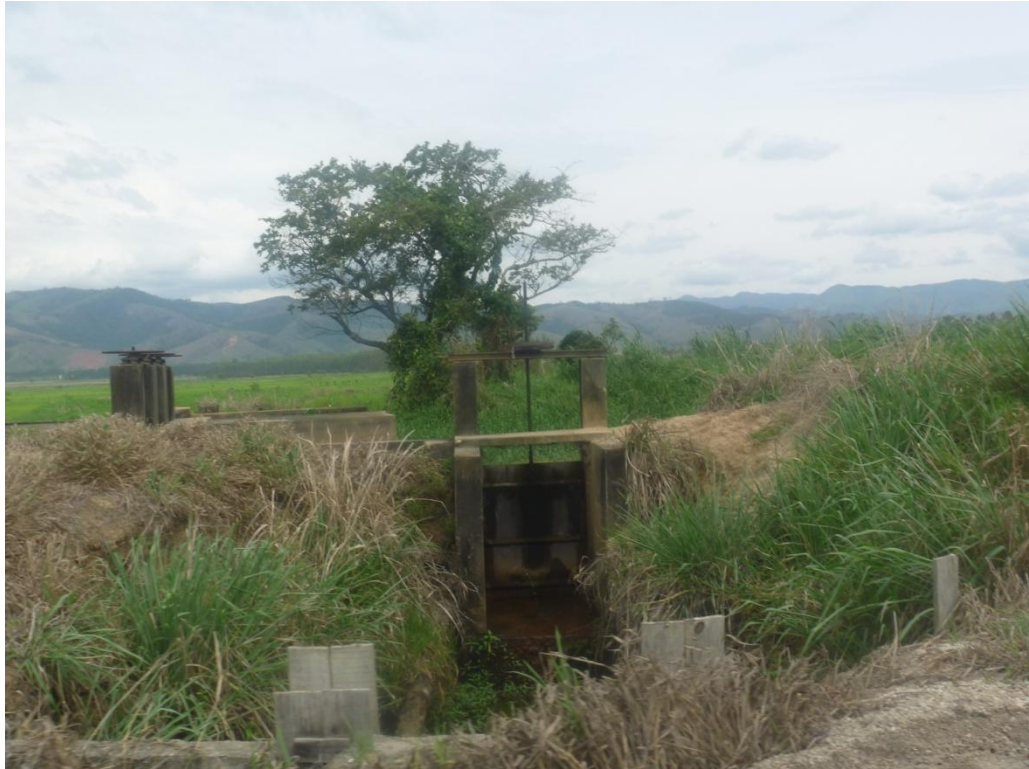
Detalhe da infraestrutura instalada devido à cultura do arroz (Comporta para conter a água)