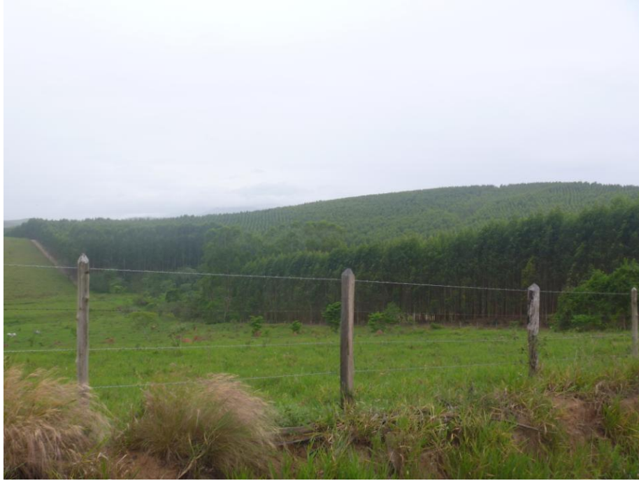
Área Extensa destinada à Silvicultura