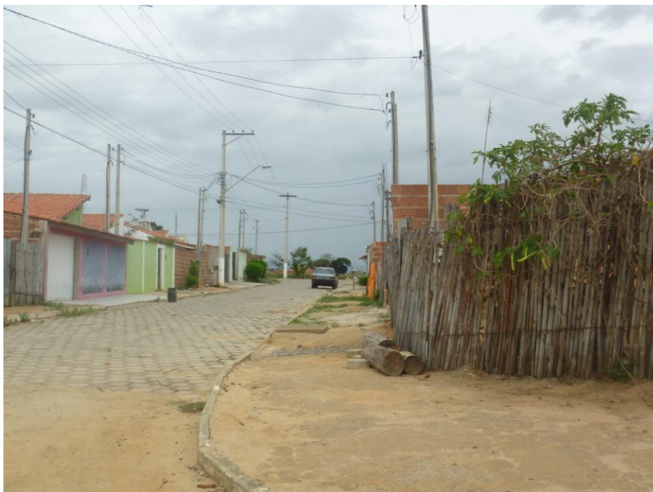
Padrão Construtivo - CDHU Descaracterizado – Bairro Bela Vista