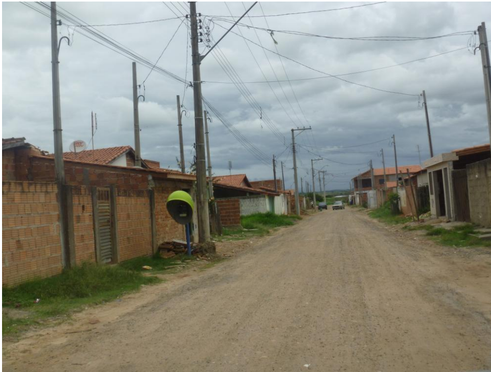
Bairro Santa Teresinha – Habitações de Baixo Padrão Construtivo