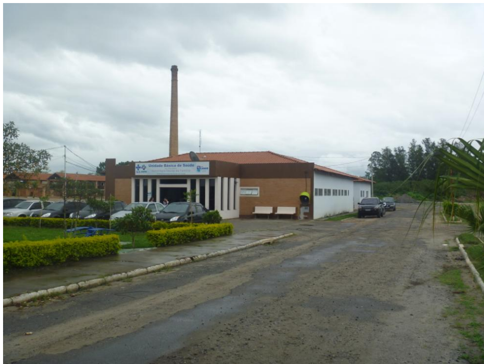
UBS – Centro