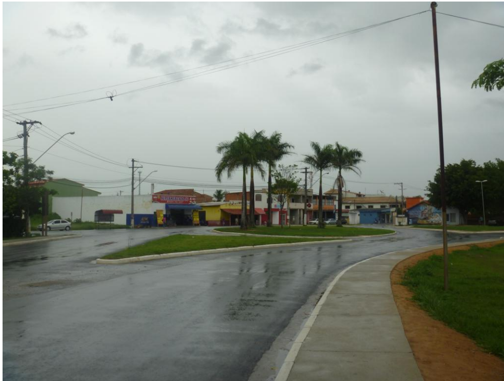
Área de Comércio e Serviços de Canas – Centro