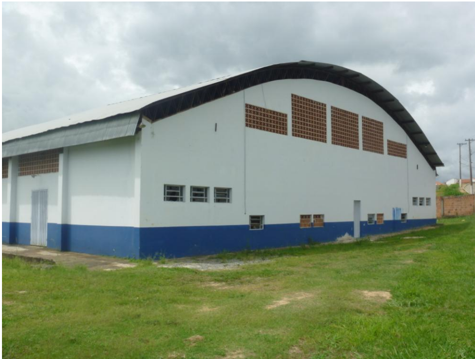
Ginásio Municipal - Bairro Zalino