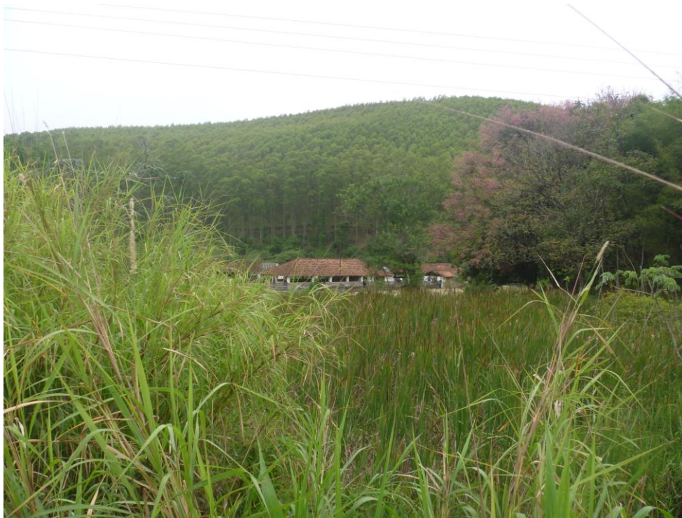
Capim para o Gado e Silcicultura