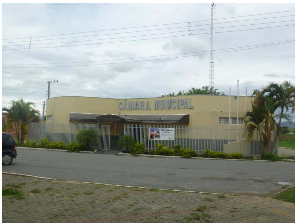
Câmara Municipal – Praça João Paulo II