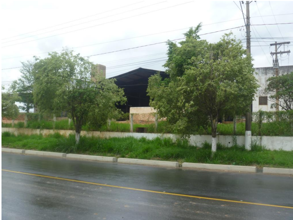
Distribuidora de Cerâmica Shimazu – Bairro Caninhas