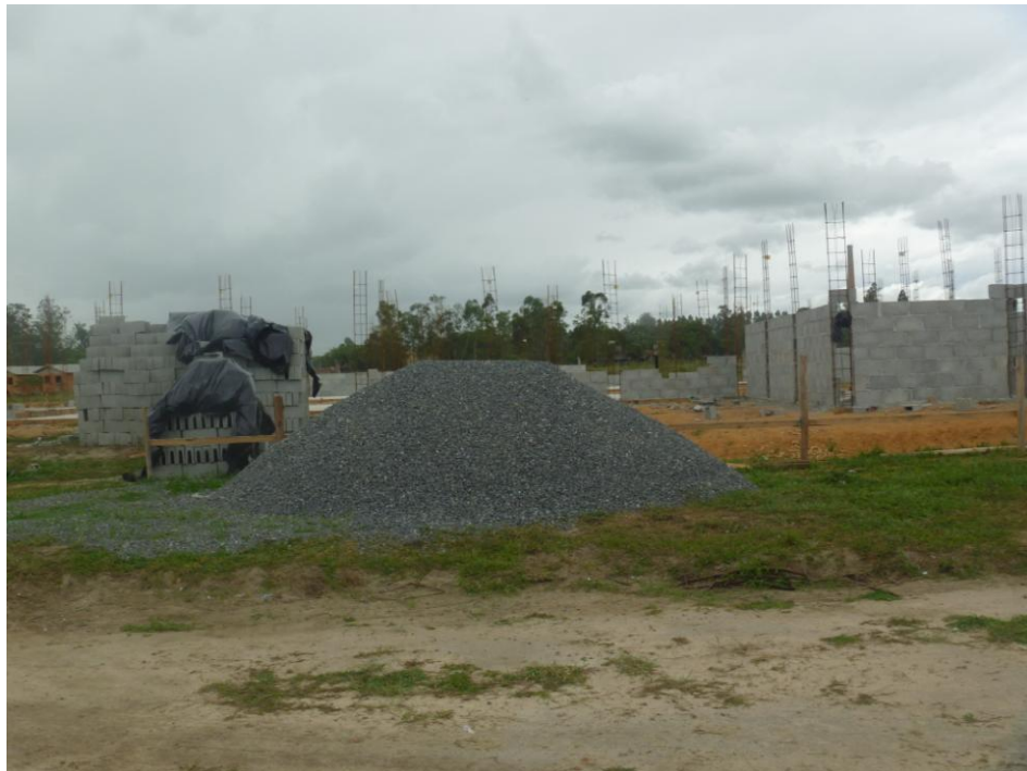
Escola Municipal em Construção – Bairro Santa Terezinha