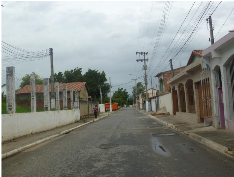
Padrão Construtivo – Bairro Zalino