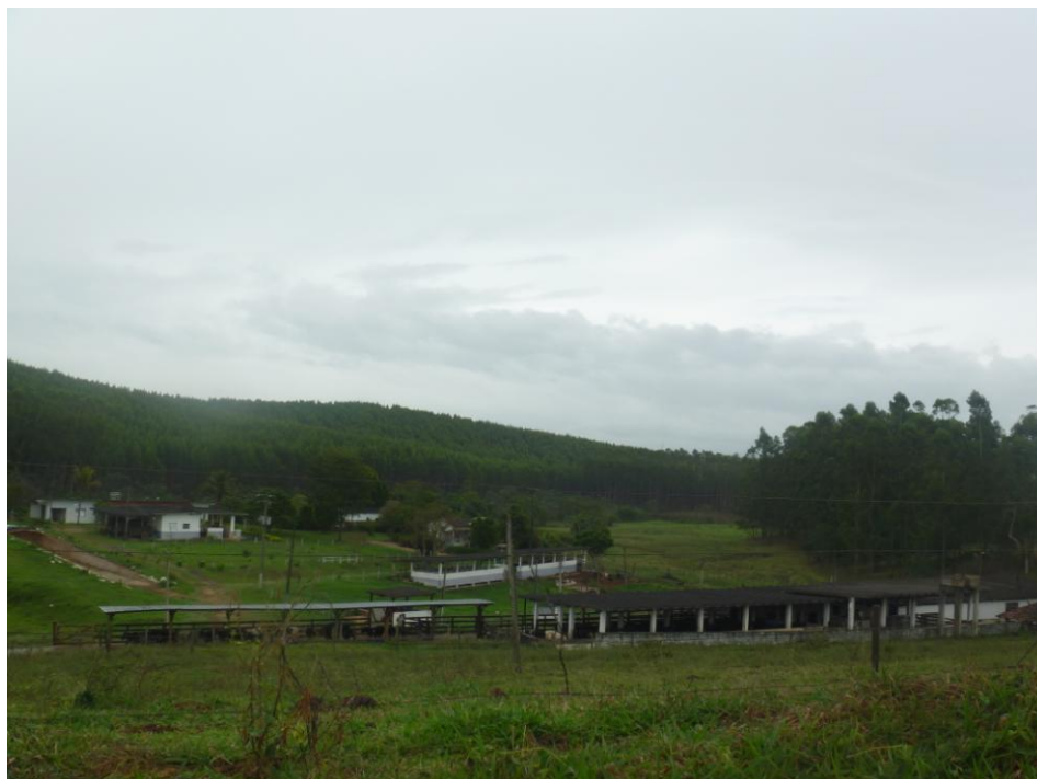
Estrutura para a Pecuária Leiteira e Silvicultura Estrada Salamanca