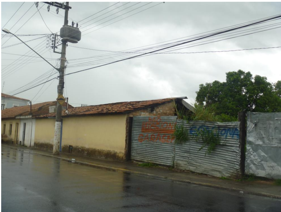
Casas em Processo de Desapropriação