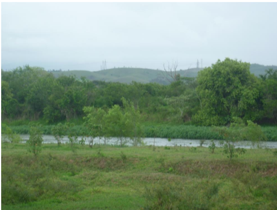
Antiga Área de Exploração de Argila Próximo ao Rio Paraíba do Sul - Bairro Caninhas