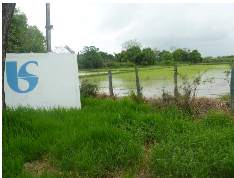
Estação de Tratamento de Esgoto – Bairro Santa Terezinha