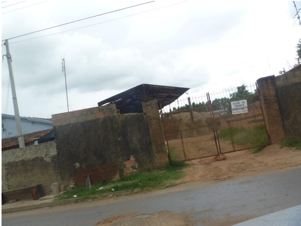
Cerâmica Nova Canas – Bairro Santa Terezinha