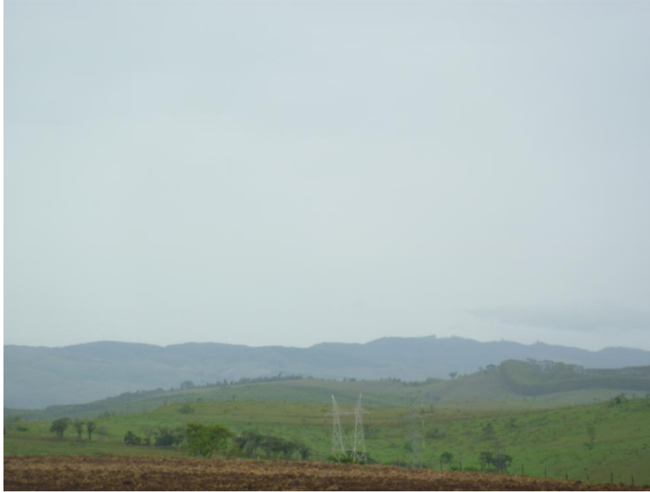
Vistada Geral da UIT Ribeirão Canas Ao Fundo: Serra Quebra-Cangalha