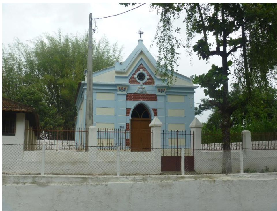
Igreja Santo Antônio – Bairro Caninhas