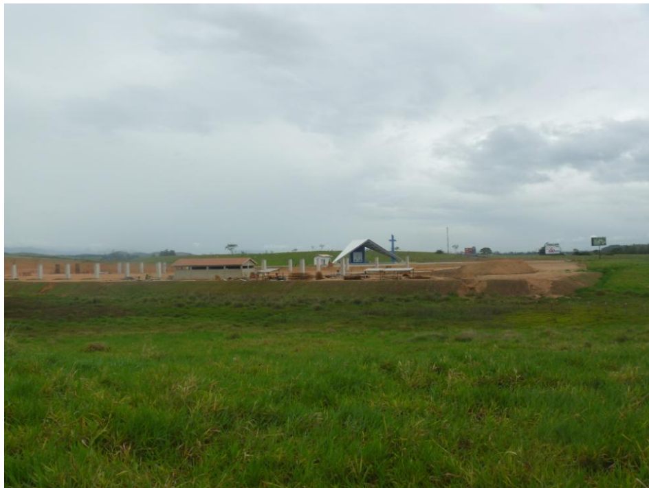
Futura Sede da Renovação Carismática - Próximo da Via Dutra