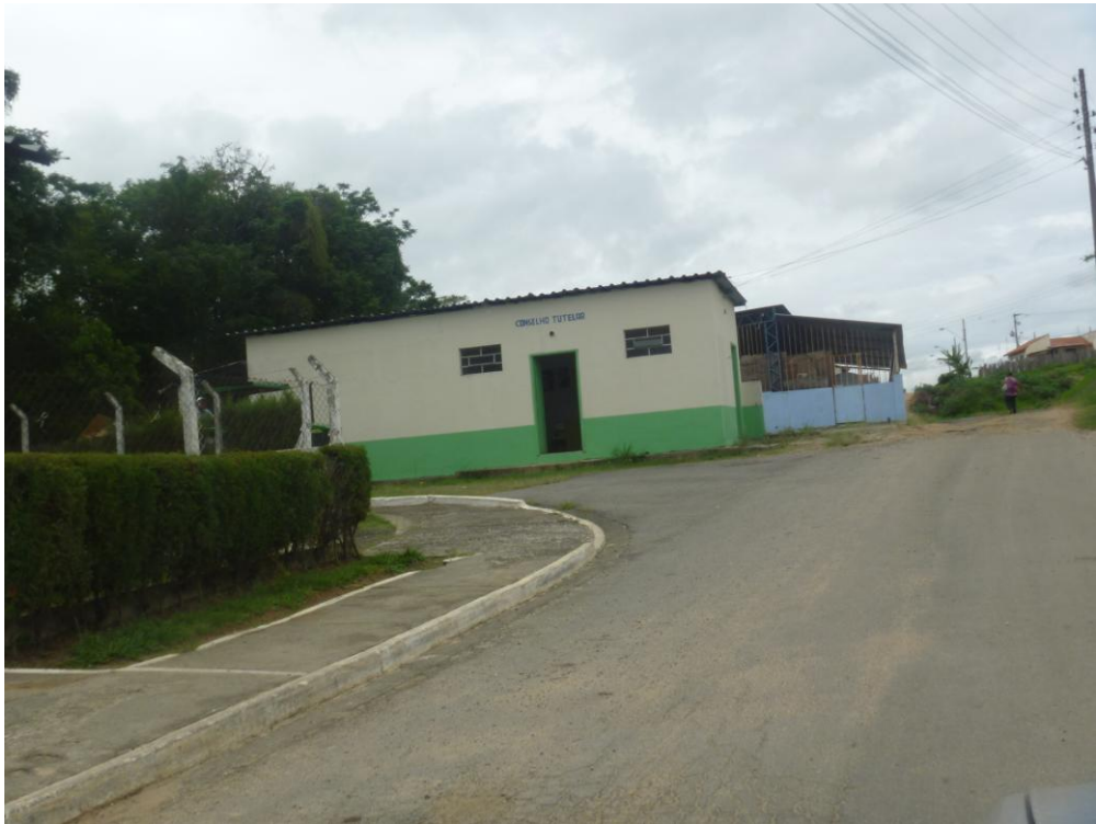
Conselho Tutelar – Bairro Zalino