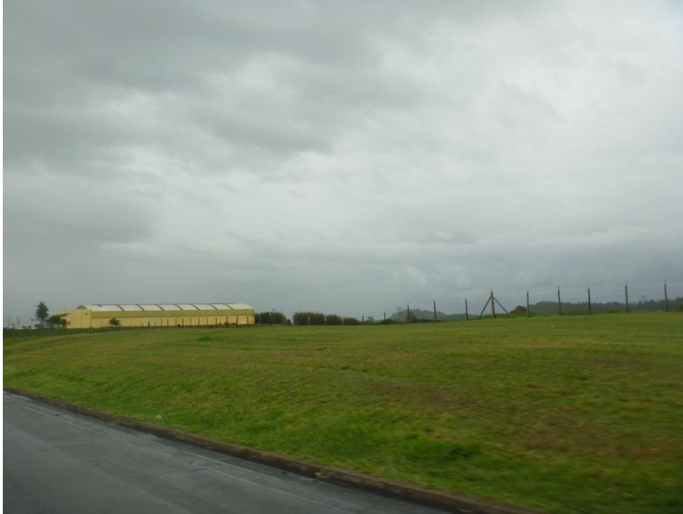
Área Industrial – Via Dutra – Divisa entre Canas e Lorena