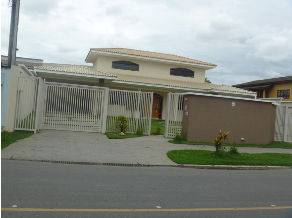
Casas de Alto Padrão – Avenida 22 de Março