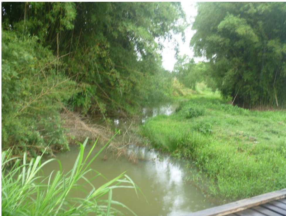
Ribeirão Canas – Estrada Salamanca