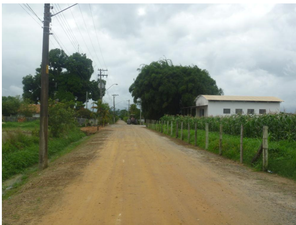
Beneficiadora de Arroz – Bairro Rua do Meio