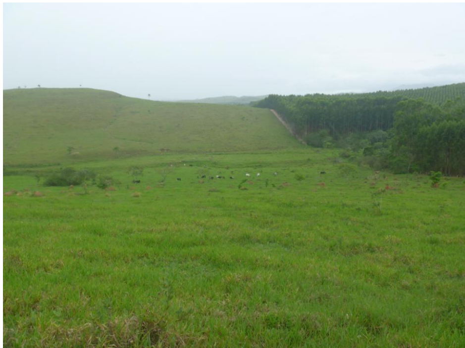
Área destinada à Silvicultura e Pecuária Leiteira