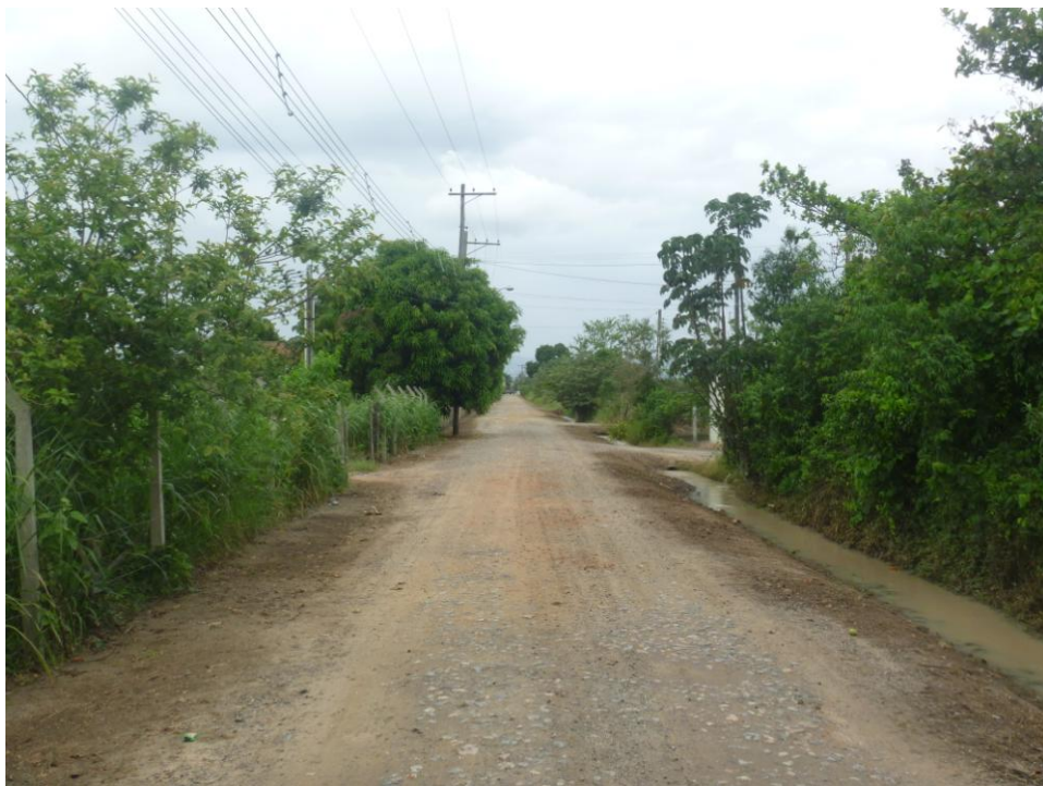
Chácaras de Produção – Bairro Rua do Meio