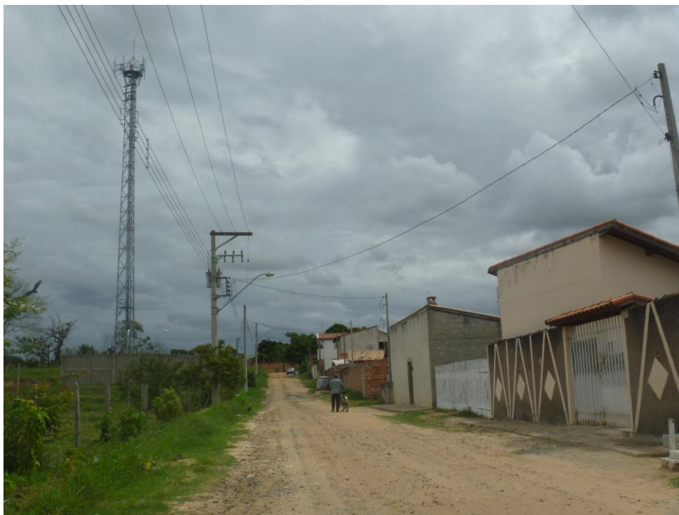
Padrão Residencial – Vila São João