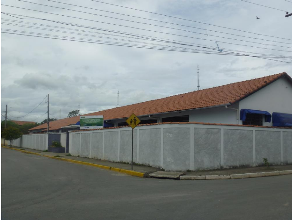
EMEF João Nery Marton