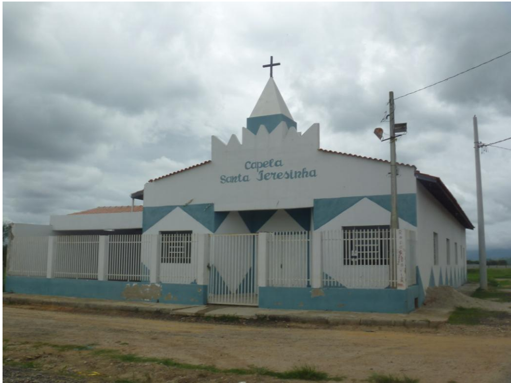
Capela Santa Teresinha – Bairro Santa Teresinha