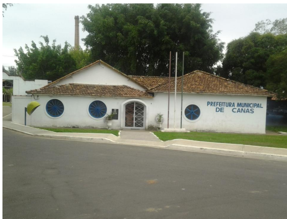
Prefeitura Municipal - Rodovia Osvaldo Ortiz Monteiro

A seguir é apresentado o registro fotográfico do trabalho de campo realizado em 09/11/2012.