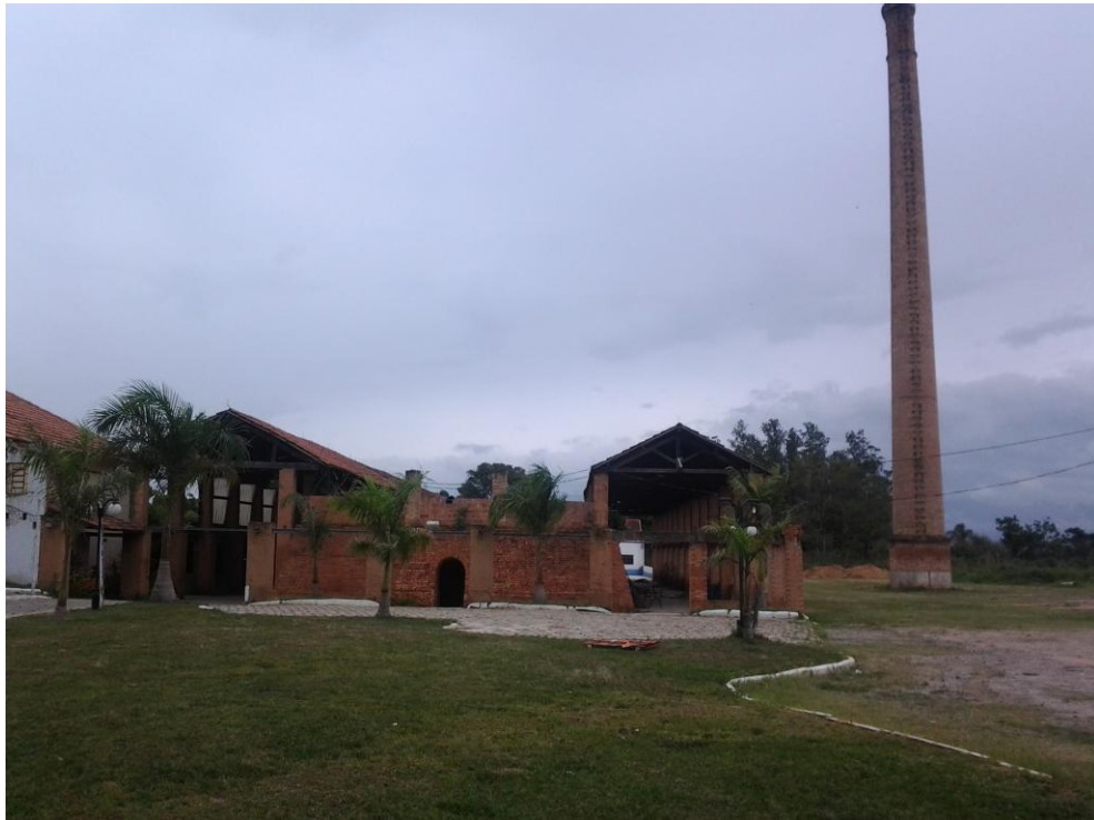
Fábrica de Cerâmica Progresso – Bem Tombado