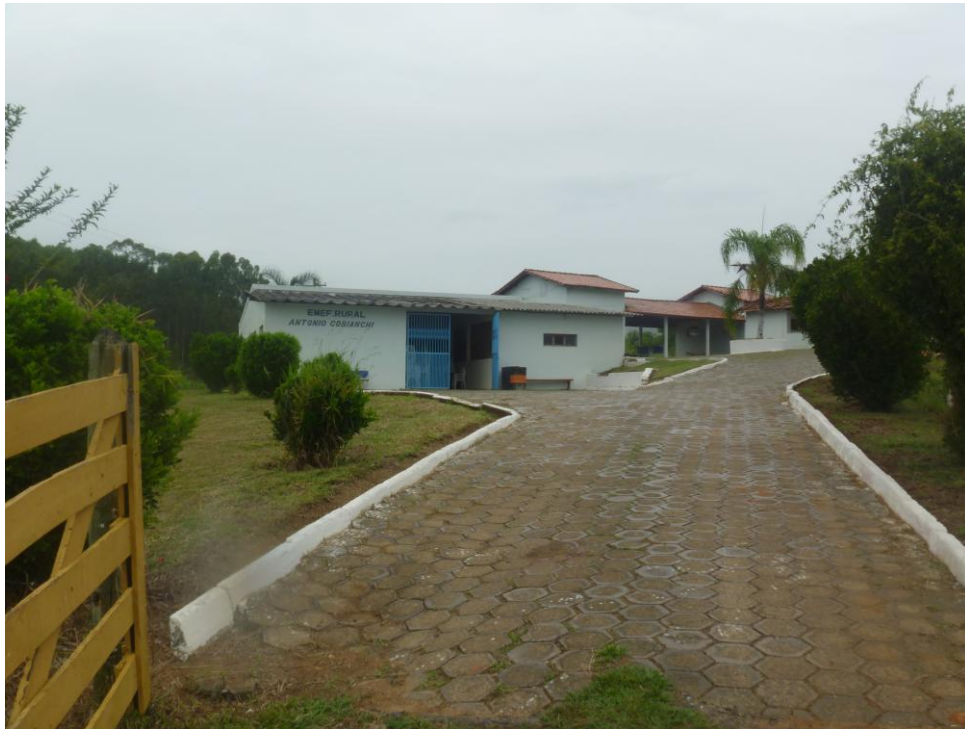
EMEF Rural Antônio Cobiانchi