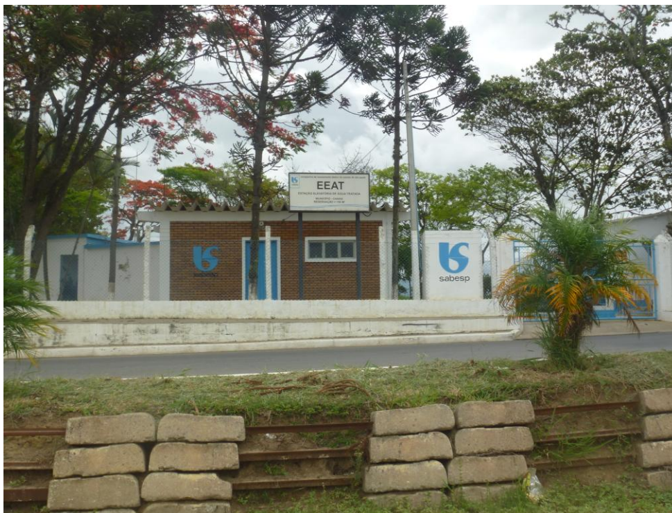
Estação Elevatória de Água Tratada – Avenida Humberto Borceto