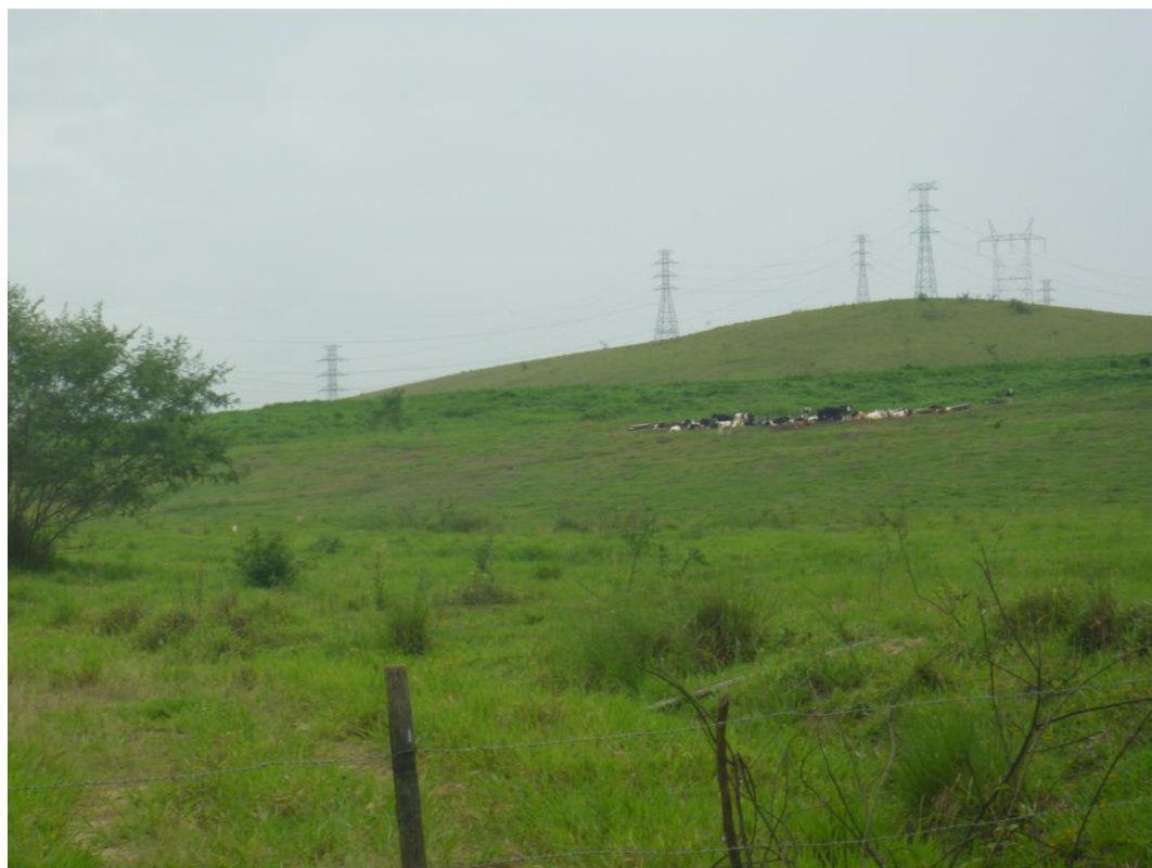
Terreno da Termoelétrica – Estrada Municipal do Cantagalo

A seguir é apresentado o registro fotográfico do trabalho de campo realizado, em 09/11/2012.