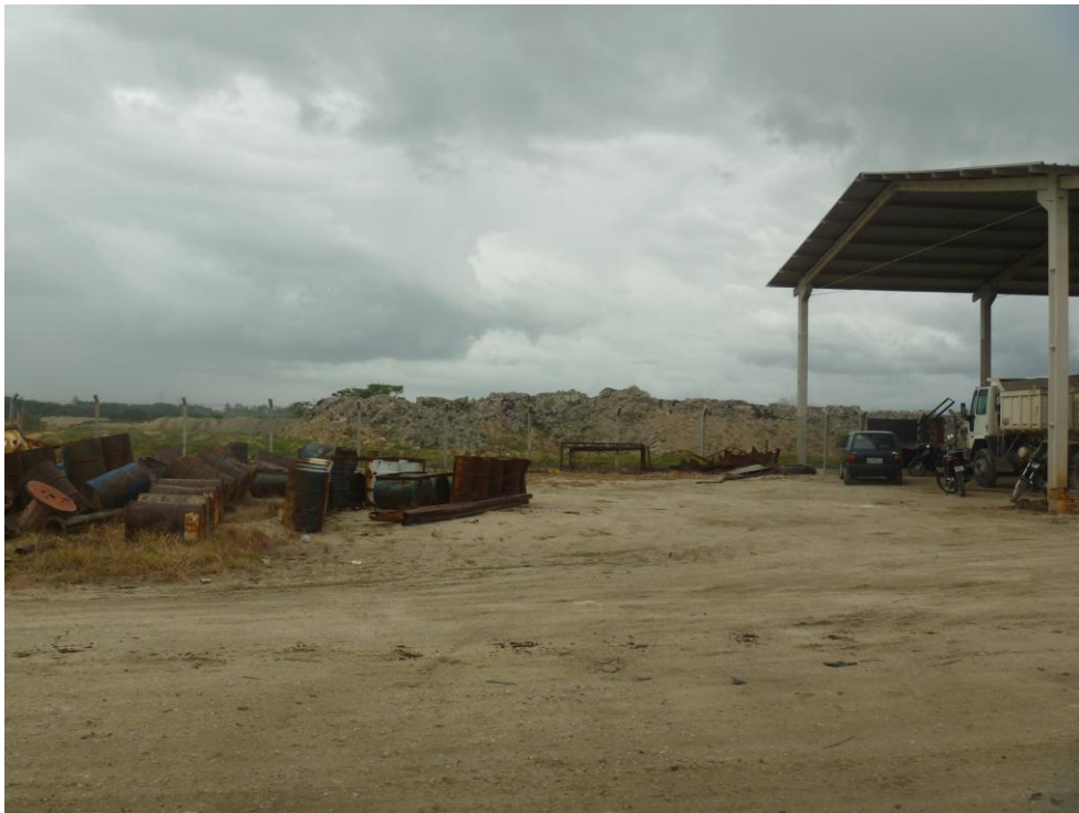
Porto de Areia – Bairro Santa Terezinha