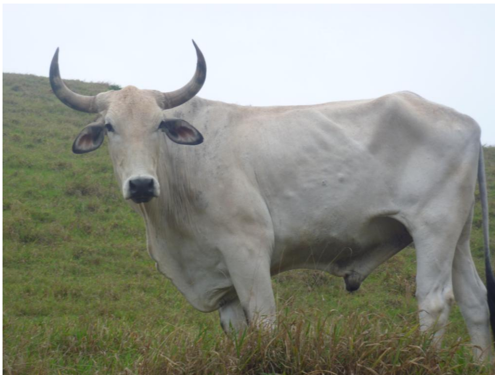
Pecuária de Corte – Bairro Cantagalo