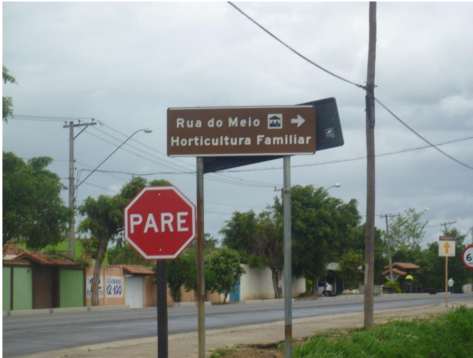
Horticultura Familiar – Bairro Rua do Meio