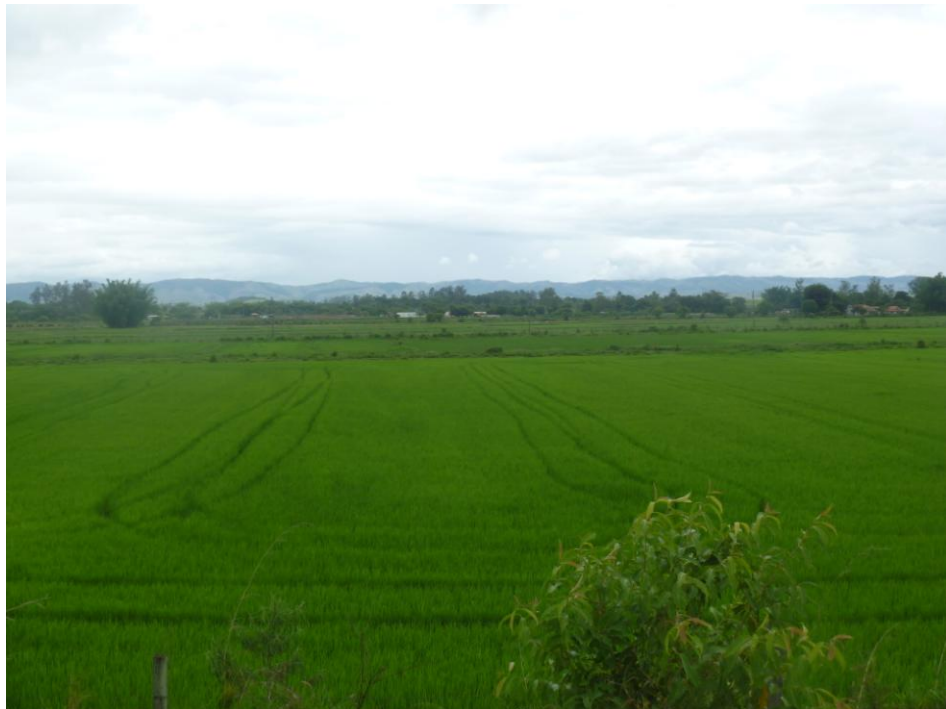
Rizicultura – Bairro Caninhas