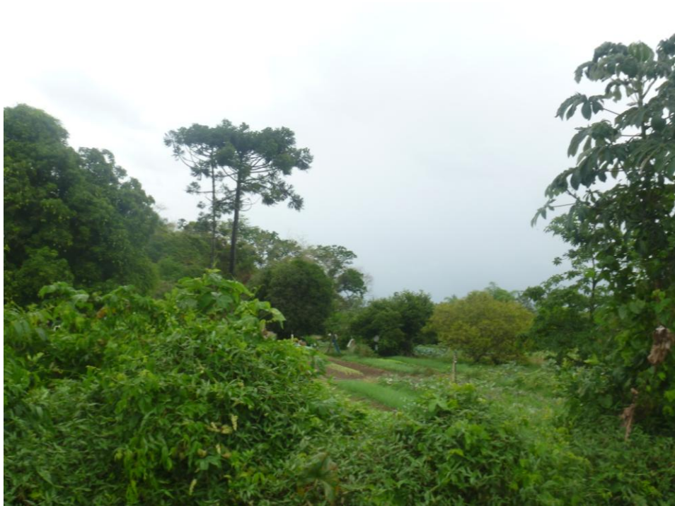
Produção de Hortifrutigranjeiros - Agricultura Familiar Rua do Meio