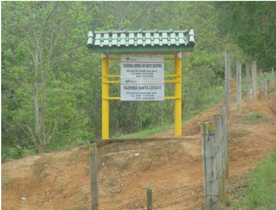
Fazendas Fibria – Bairro Canta Galo