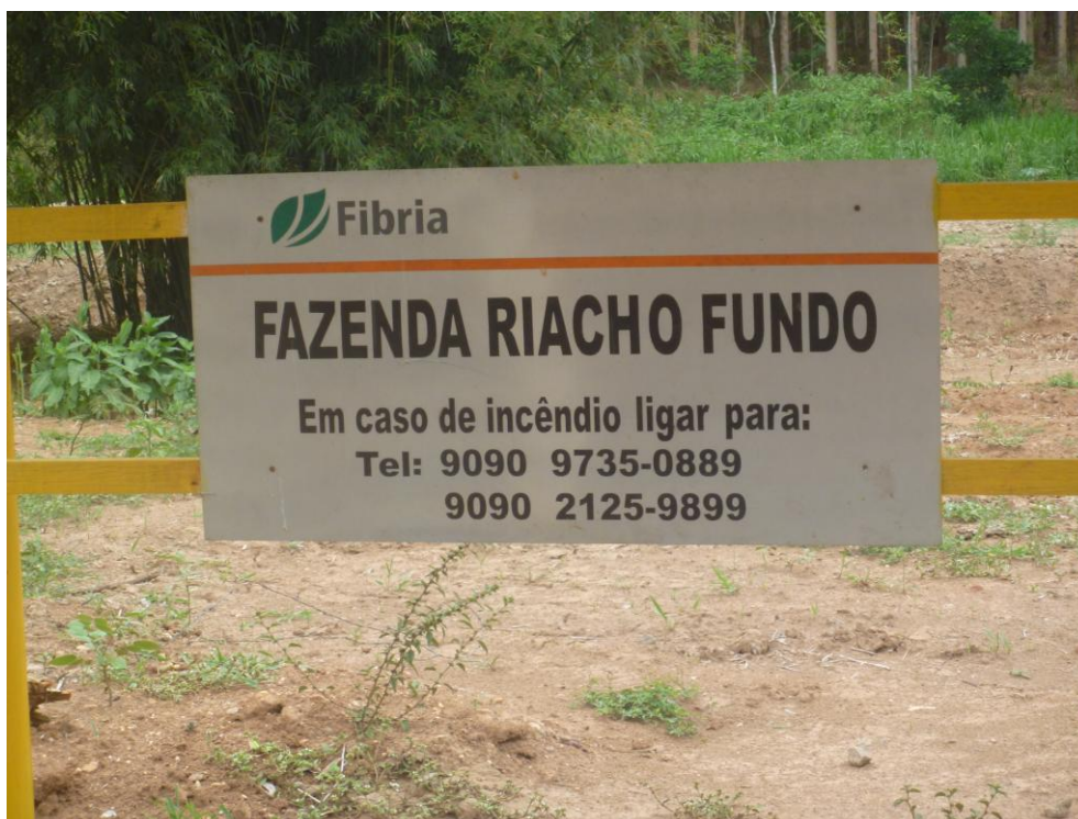
Área da Fibria