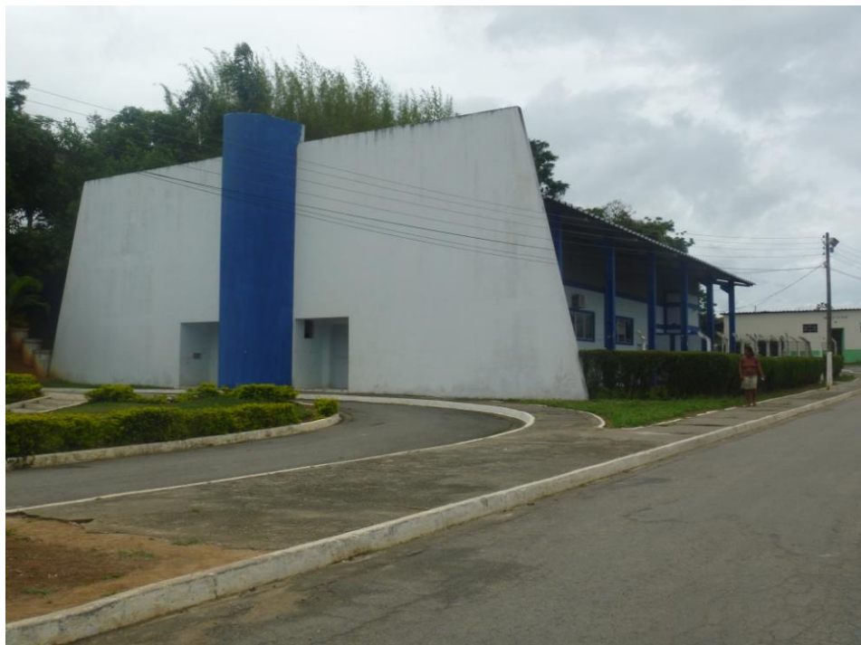
Casa de Cultura – Bairro Zalino