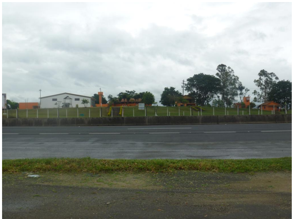
Espaço Para Eventos – Via Dutra Trevo Canas