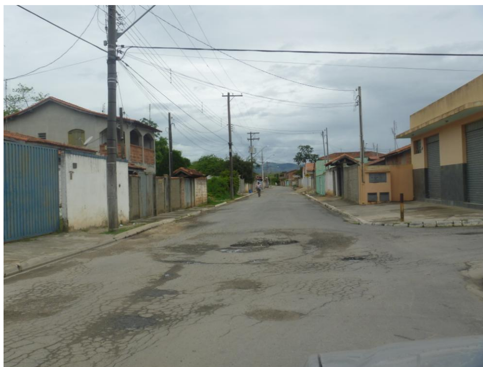
Padrão Residencial – Rua Antônio Favalli – Centro