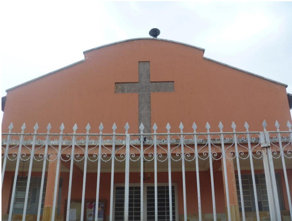
Igreja Nossa Senhora Auxiliadora – Centro