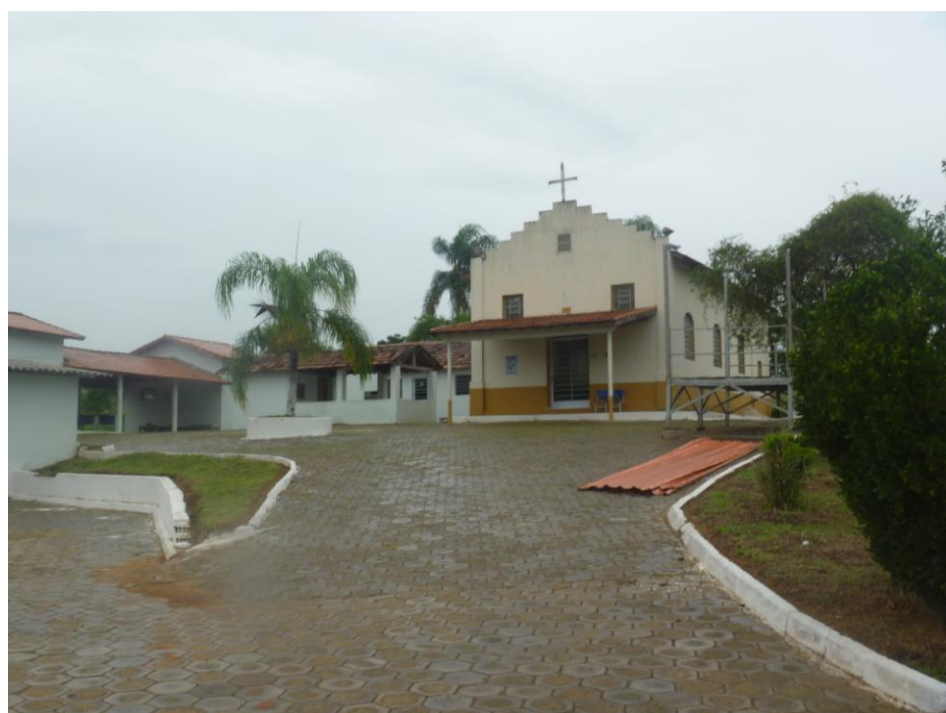
Capela São Bendito – Bairro Canta Galo