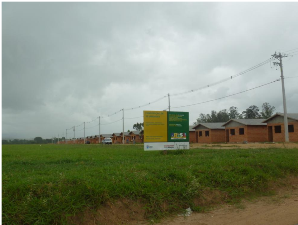
Minha Casa Minha Vida – Bairro Santa Teresinha